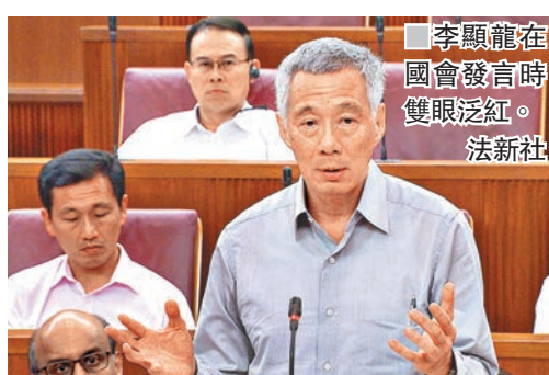
李顯龍在國會發言時雙眼泛紅。

李顯龍表示，他從沒想過父母去世後，家中會爆發這些矛盾，他再次重申不會控告妹妹李瑋玲和弟弟李顯揚，希望有一天弟妹對他的怨恨情緒會消退，一家人能和好如初，也希望弟妹不會把怨恨傳到下一代。