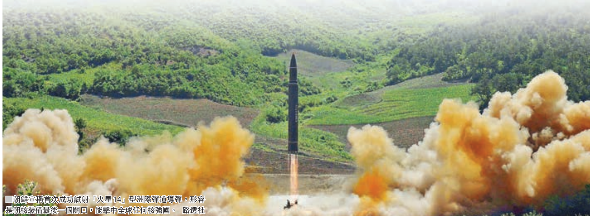
朝鮮宣稱首次成功試射「火星14」型洲際彈道導彈，形容是朝核裝備最後一個關口，能擊中全球任何核強國。