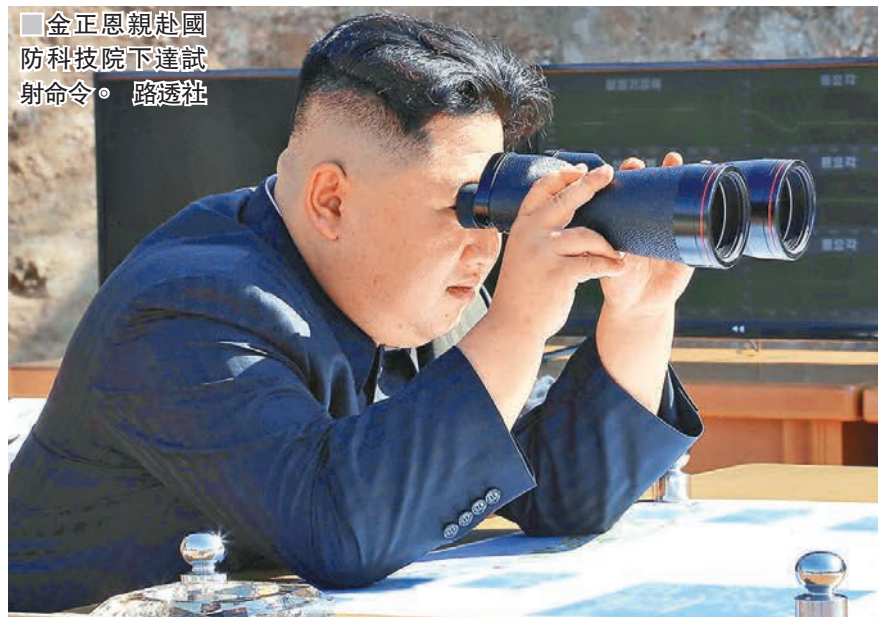
金正恩親赴國防科技院下達試射命令。