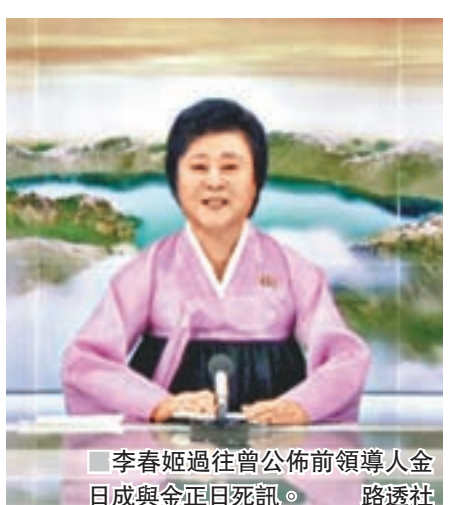
李春姬過往曾公佈前領導人金日成與金正日死訊。

中國外交部發言人耿爽昨日表示，中方反對朝方違反安理會決議進行導彈發射，敦促朝方勿再採取有違聯合國安理會決議的行為，為重啟對話談判創造必要條件，希望所有有關方面保持冷靜克制，盡快緩解朝鮮半島緊張局勢。美國總統特朗普在推特聲稱，中國對朝鮮可能會有「大動作」，一勞永逸地解決「鬧劇」，外界視為對中方施壓。耿爽對此強調，為解決朝鮮半島核問題，中方的貢獻有目共睹、作用不可或缺。■中國外交部網站