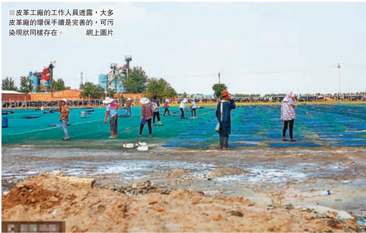
皮革工廠的工作人員透露，大多皮革廠的環保手續是完善的，可污染現狀同樣存在。