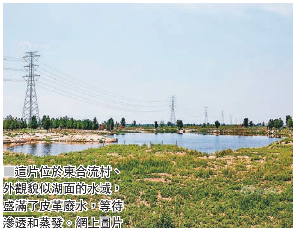
這片位於東合流村、外觀類似湖面的水域，盛滿了皮革廢水，等待滲透和蒸發。網上圖片