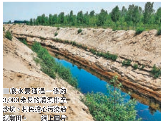
廢水要通過一條約3,000米長的溝渠排至沙坑。村民擔心污染沿線農田。網上圖片