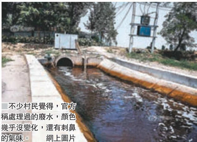
不少村民覺得，官方稱處理過的廢水，顏色幾乎沒變化，還有刺鼻的氣味。