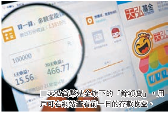
天弘貨幣基金旗下的「餘額寶」，用戶可在網站查看前日的存款收益。

香港文匯報訊(記者 張豪 上海報導)以天弘貨幣基金為基礎的餘額寶，至今年6月底規模已達到了1.43萬億元(人民幣，下同)，超過了內地吸儲能力最強的股份制銀行招商銀行(3968)2016年年底的個人活期和定期存款1.3萬億元總額。去年，招商銀行個人活期存款餘額為9,516億元，個人定期存款餘額為3,329億元。