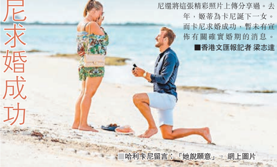
■哈利卡尼留言：「她說願意」。