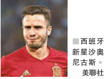
■西班牙新星沙奧尼古斯。