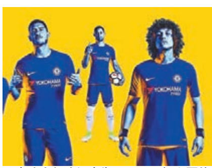
■車路士新波衫廣告。網上圖片

英超足球聯賽衛冕冠軍車路士日前公佈了轉由「一別」贊助的新球季戰衣，主場為傳統藍色，作客為白色。球衣領口有藍色邊作飾，設計簡潔。新廣告由夏薩特、大衛雷斯、加利卡希爾和簡迪等主力球員當模特兒，卻不見傳或轉投曼聯的中場尼曼查馬迪。