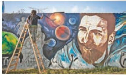
■美斯在家鄉羅薩里奧的壁畫。

上周五是美斯的大好日子，阿根廷「球王」回到家鄉城市羅薩里奧跟一起多年的青梅竹馬女友安東妮娜結為連理。而據西班牙傳媒報道，美斯將會在蜜月假期之前，先返回巴塞羅那完成續約，對美斯和巴塞來說都是喜上加喜的好消息。