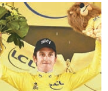
■湯馬斯穿上黃戰衣。

昨天環法單車賽第一賽段在德國杜塞爾多夫舉行的14公里個人計時賽，天空車隊的湯馬斯以16分04秒的成績爆冷奪冠。