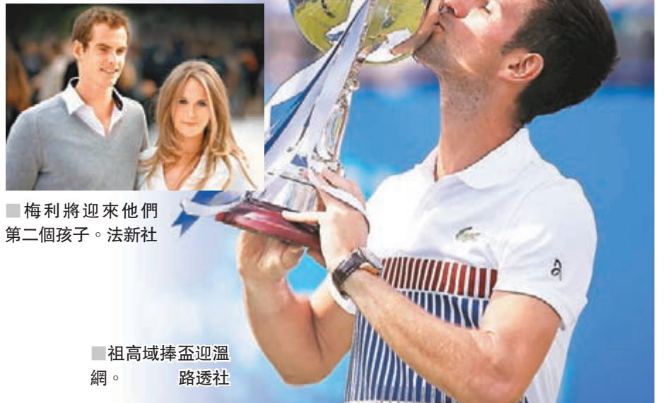
■梅利將迎來他們第二個孩子。