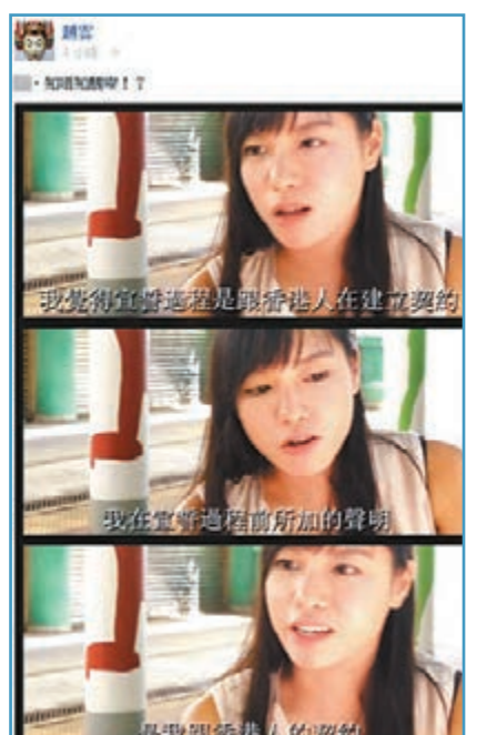
「趙雲」狠批Cheap禎講嘢「唔知醜」。