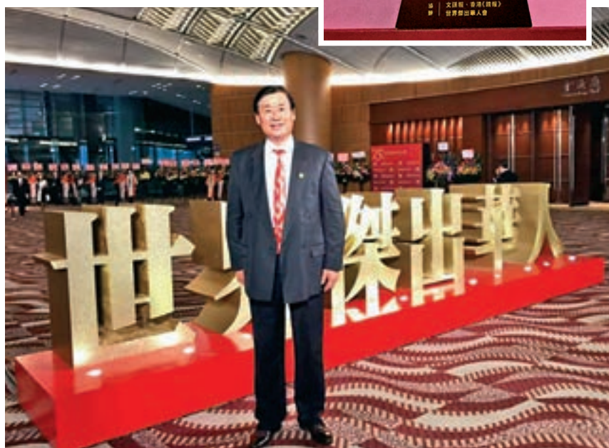
王書君榮獲第五屆世界傑出華人藝術家大獎