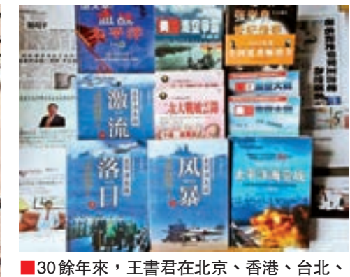
30餘年來，王書君在北京、香港、台北、紐約等地從事研究與寫作，總共寫作出版發行了10餘本著作，頗受廣大讀者的好評。