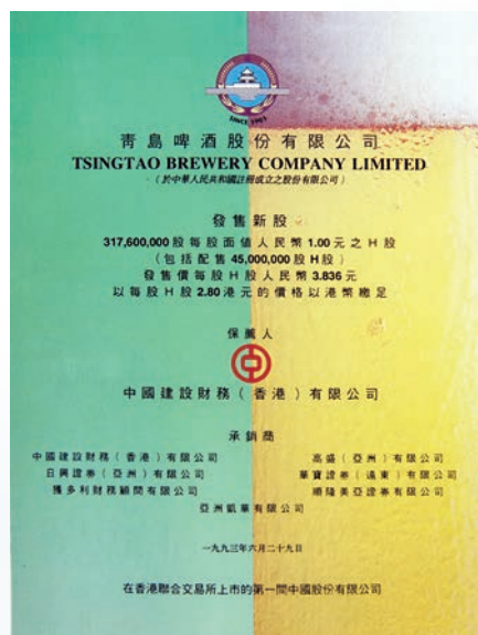
1993年，中銀國際的前身—中建財作為獨家保薦人主持第一家H股—青島啤酒公司的海外發行上市。

主持第一家H股—青島啤酒公司的海外發行上市；此後在中國移動、中國石油、中國聯通、中國海洋石油等大型國企海外公開發行中發揮了重大作用。2007年協助中國銀行集團在香港發行30億元人民幣債券，成為推動人民幣國際化的先鋒。2014年協助五礦聯合體向Glencore Xstrata plc(嘉能可)收購秘魯Las Bambas(拉斯邦巴斯)銅礦股權，是中國金屬礦業史上迄今為止實施的最大一次境外收購項目。2015年協助中國銀行集團推出40億美元「一帶一路」債券，創造多項市場第一。長期為國家推進「一帶一路」建設的龍頭企業提供包括股權融資和債券發行等在內的全面服務。2016年，協助中銀香港和中國信達成功完成總價為680億港元的南商股權交割，刷新了亞洲地區(除日本外)銀行股權交易項目和中國併購市場金融企業資產交易項目的規模紀錄，是境外國有資產保值增值模式探索創新的一次重大突破；同年，協助中銀航空租賃在港上市，樹立了全球經營性飛機租賃公司在亞洲上市的里程碑。此外，中銀國際積極開展「滬港通」與「深港通」業務，助力內地與香港資本市場互聯互通。