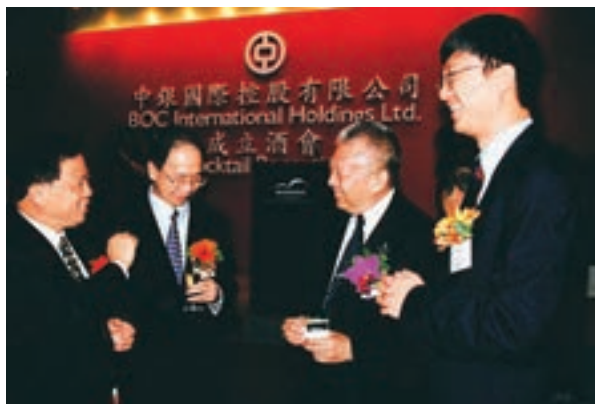
1998年7月10日，中銀國際控股有限公司在香港註冊成立，圖為公司成立酒會現場。

中銀國際前身是始建於1979年的中國建設財務(香港)有限公司(以下簡稱「中建財」)。1998年7月，中銀國際在東方之珠百業待興之際遷冊香港。三十八年櫛風沐雨，中銀國際以服務香港繁榮穩定為己任，逐步發展成為立足香港、輻射全球主要資本市場，海外綜合實力領先的中資投行，以香港為總部，在全球各地設立了55家附屬公司及聯營公司，構建以客戶為中心的營銷平台，為海內外客戶提供包括企業融資、收購兼併、財務顧問、證券銷售、定息收益、私人銀行、資產管理、直接投資、股票衍生產品、槓桿及結構融資、環球大宗商品等在內的一站式的投資銀行服務。