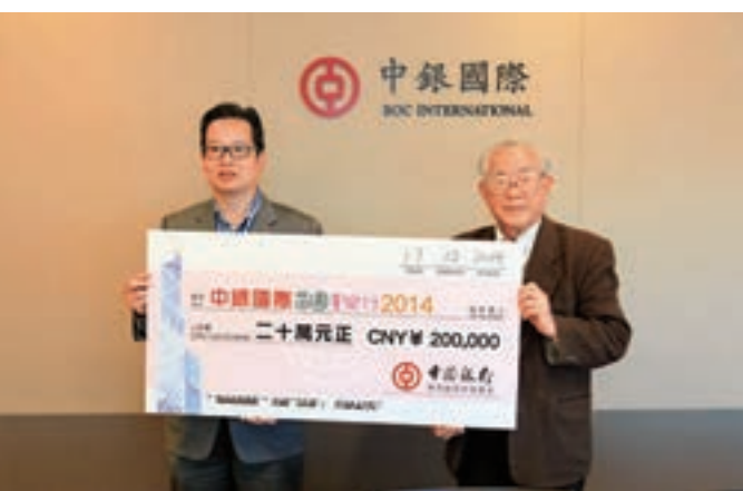
中銀國際積極履行企業社會責任，全力支持公益慈善事業。

中銀國際長期支持香港經濟發展和民生工程。2000年，中銀國際協助完成香港第一個政府公有機構私營化項目—香港地鐵有限公司在聯交所掛牌；2004年，中銀國際協助香港特區政府首次成功發行200億元環幣債券，市場反響熱烈，獲得超額認購；近年來，中銀國際多次向特區政府建言獻策，為特區政府更好地把握人民幣國際化、前海自貿區、粵港澳大灣區與「一帶一路」建設等發展機遇而提供專業服務。