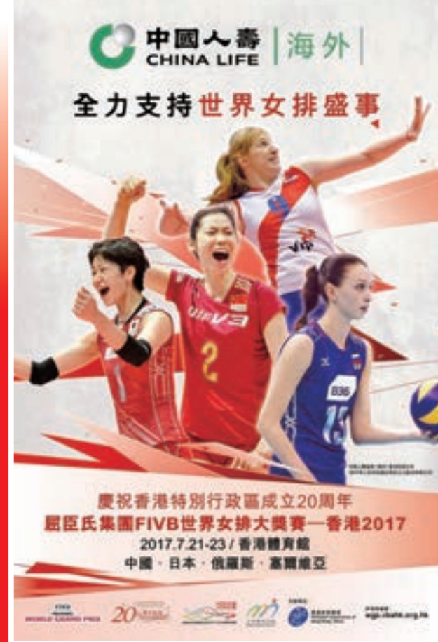
■中國人壽(海外)全力支持世界女排盛事，全城熱切期待。

中國品牌，永久承諾，全面保障 399 95519 www.chinalife.com.hk