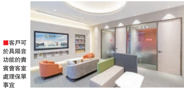
■客戶可於具隔音功能的貴賓會客室處理保單事宜

勇於開拓創新也是中國人壽(海外)成功突圍而出的主因。自2013年起，中國人壽(海外)分別在北角、灣仔及油麻地開設以「保險商店」為概念的客戶中心，履行公司持續提升服務質素的承諾。客戶中心類似銀行分行般，除了提供繳費、查詢、保單更改及款項領取等傳統保單服務外，更有專業理財顧問提供財務需要分析。另外，為持續提高服務水平，中國人壽(海外)推出神秘客戶銷售及服務體驗計劃，建立內部神秘人隊伍，從客戶角度體驗行銷及售後服務。