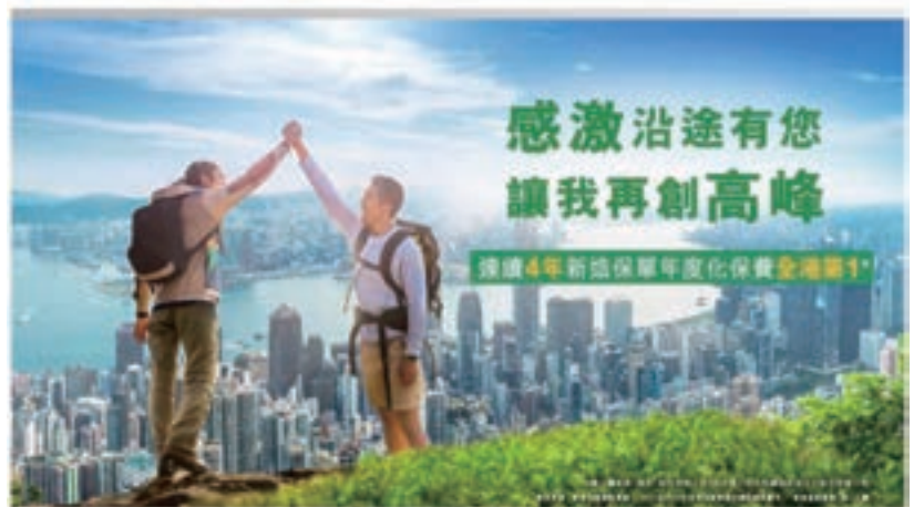
■中國人壽(海外)新造保單年度化保費連續4年穩居市場首位

正如公司穩健的經營理念一樣，中國人壽十分重視風險管理，從而穩中前進、穩中發展壯大。去年，中國人壽集團公司成功收購廣發銀行，成為單一最大股東，現時國壽不只是一家保險公司，而是由保險轉向為金融保險的綜合公司。由此可見，公司未來發展戰略十分清晰，分別是創新驅動、綜合經營及建設成為國際一流金融保險集團，而公司保險、投資及銀行三大板塊的協同效應亦開始形成。