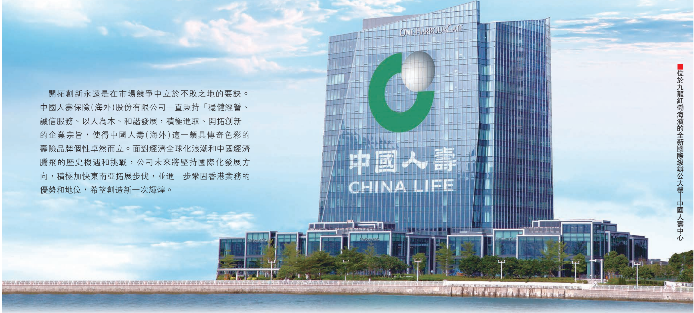
位於九龍紅磡海濱的全新國際級辦公大樓——中國人壽中心

開拓創新永遠是在市場競爭中立於不敗之地的要訣。中國人壽保險(海外)股份有限公司一直秉持「穩健經營、誠信服務、以人為本、和諧發展、積極進取、開拓創新」的企業宗旨，使得中國人壽(海外)這一頗具傳奇色彩的壽險品牌個性卓然而立。面對經濟全球化浪潮和中國經濟騰飛的歷史機遇和挑戰，公司未來將堅持國際化發展方向，積極加快東南亞拓展步伐，並進一步鞏固香港業務的優勢和地位，希望創造新一次輝煌。