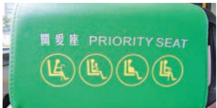
關愛座的座位會有不同顏色。 資料圖片

網絡公審： 網絡公審是指市民把日常生活看見的社會不公拍照或拍片放上網，讓廣大網民在道德高地批判事件，當中的人物可能面臨被「人肉搜尋」、改圖、人身攻擊、辱罵等，對當事人造成嚴重影響。雖然網絡公審能起一定監察的效果，但網民只憑表面去判斷曲定，並不客觀，容易造成網絡欺凌。