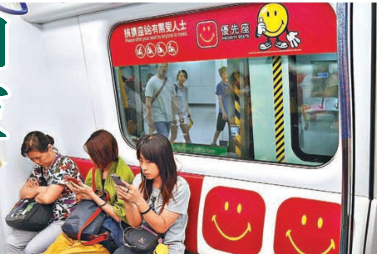
即使在繁忙時段，不少人也寧願不坐關愛座，以免被放上網「公審」。