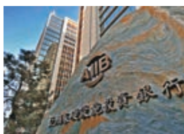
■ 亞投行總部 資料圖片

穆迪稱，展望穩定反映穆迪對亞投行的期望，即資本基數大及股東強有力的支持將有助擴展其開發活動，同時保持其償還任何即將到來債務的能力。