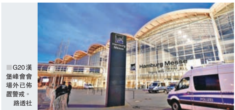
■ G20漢堡峰會會場外已佈置警戒。

在被問及習主席會否與韓國總統和日本首相會見時，李保東說，中方願意利用峰會這個機會與更多的其他的G20成員的領導人舉行雙邊會見，但是這要取決於有沒有時間。