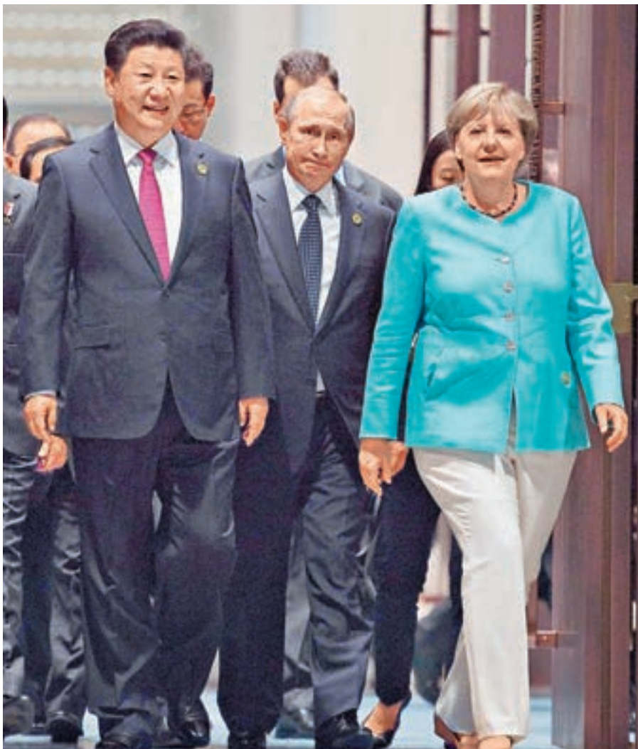
■ 習近平將訪問俄羅斯及德國，並出席G20漢堡峰會。圖為去年G20杭州峰會期間，習近平與普京及默克爾互动交流。

7月7日至8日，二十國集團領導人第十二次峰會將在漢堡舉行。外交部副部長李保東說，習主席在會上將會針對當前世界經濟形勢和國際經濟合作發表重要的講話，提出中方的立場和看法，推動各方加強政策協調，共同促進世界經濟強勁、可持續、平衡、包容的增長。中方期待漢堡峰會落實去年杭州峰會在結構改革、數字經濟等領域取得的成果，繼續建設開放型世界經濟，共同推動創新發展，傳遞G20成員國團結合作的積極信號。