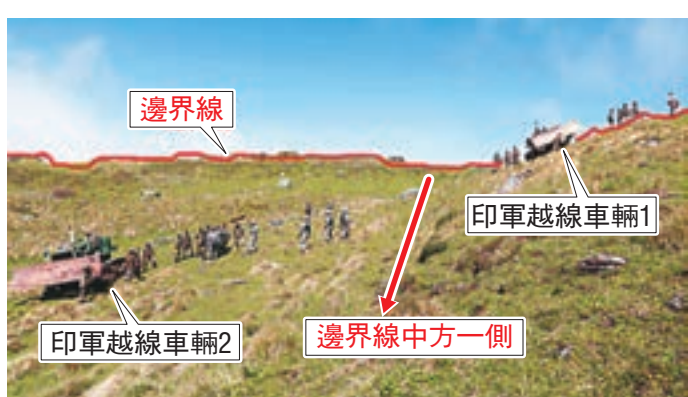
■ 印度邊防人員在中印邊界錫金段越過兩國承認的邊界線進入中國境內。

吳謙就中印對峙事件回應說，印度邊防人員在中印邊界錫金段越界進入中國境內，阻撓中國邊防部隊在洞朗地區的正常活動。中國邊防部隊已採取相應應對措施，堅決維護國家主權和領土完整。印度軍方聲稱中國軍隊進入了印方邊界，利用推土機等拆除了一些設施。吳謙明確表示，事發地域是中國領土。中方已明確要求印度方面立即改正錯誤，撤出非法越界進