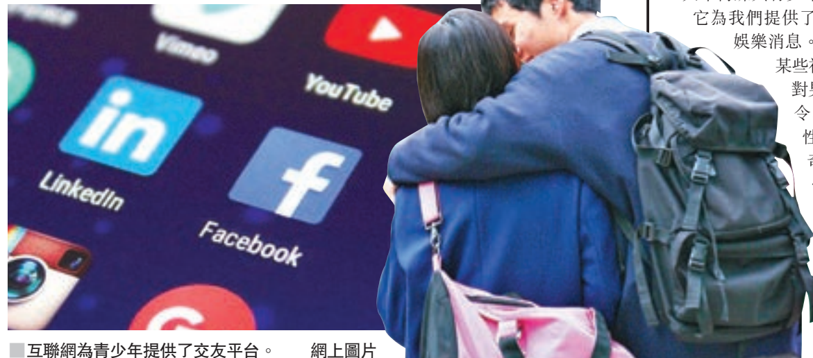
互聯網為青少年提供了交友平台。 網上圖片

此外，互聯網為青少年提供各式資訊，也為青少年提供了廣闊的交友平台，如網上交友聊天室、網上交友搜尋網頁等，增加了青少年認識異性的機會。