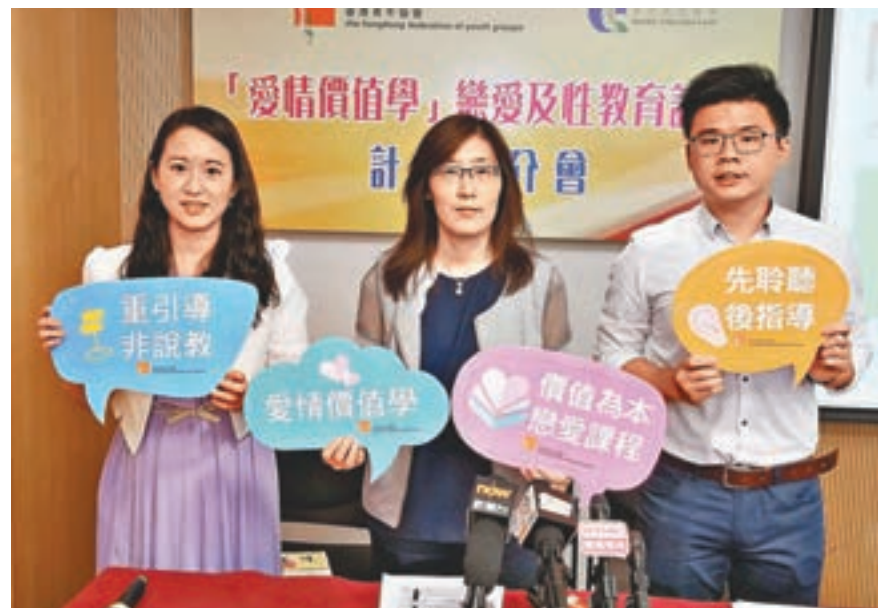
■ 有調查發現，本港近四分一小五至中六學生表示曾有戀愛經驗。 資料圖片

渴求獨立自主 青少年時期是一個自我探索的階段，雖說青少年仍需依賴父母，但也希望得到更多的自主獨立空間，如追求