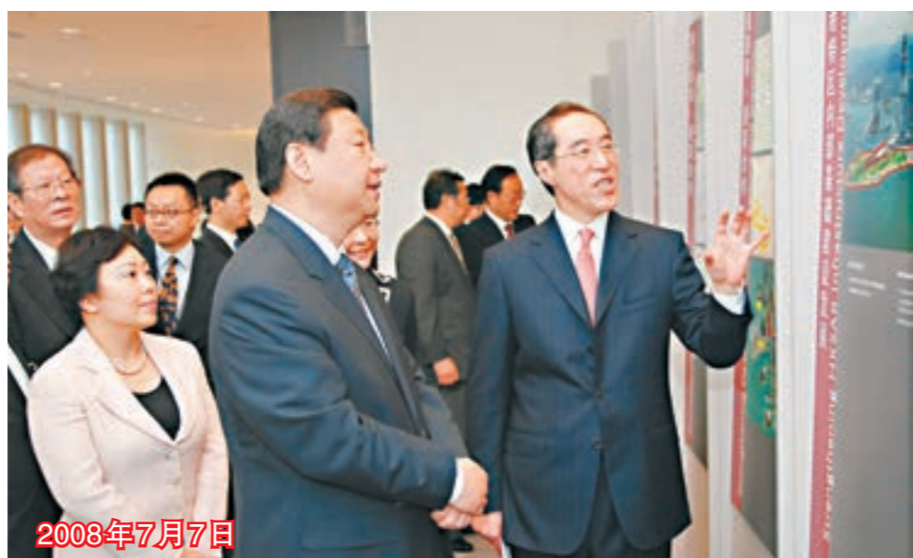
■時任國家副主席習近平在時任政務司司長唐英年陪同下於全管局參觀展品。