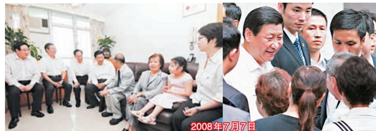
■時任國家副主席習近平在何文田冠嘉苑家訪(左圖後)，在樓下向居民握手問候(右圖)。

社評表示，回望過去、展望未來，「一國兩制」事業已經成為中國特色社會主義事業的重要組成部分，牢牢堅持「一國兩制」這項基本國策，是實現香港、澳門長期繁榮穩定的必然選擇，也是實現中華民族偉大復興「中國夢」的必然要求。只有始終堅持「一國兩制」方針不變、不動搖，切實維護「一國兩制」實踐不走樣、不變形，才能保持香港長期繁榮穩定，創造更加精彩的香江傳奇。（社評全文見文匯網www.wenweipo.com）