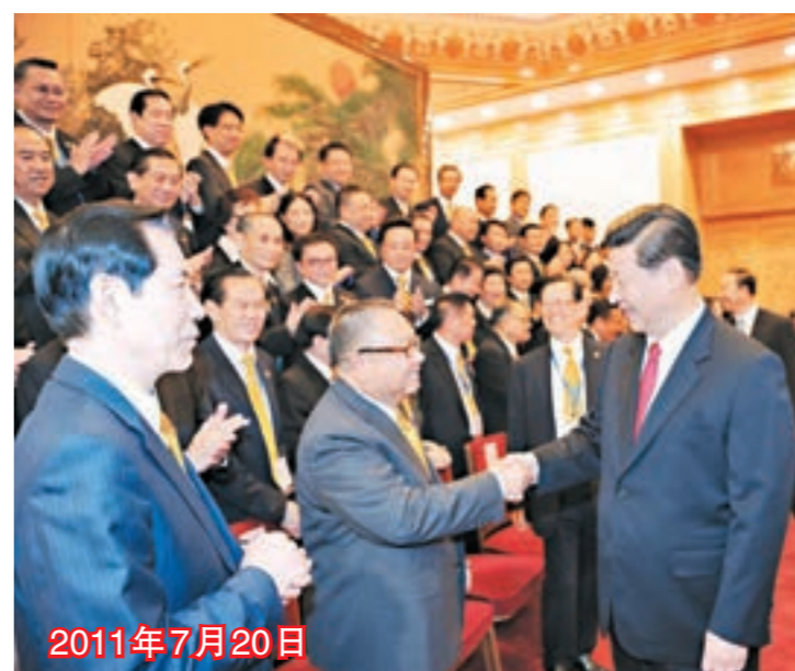
■時任國家副主席習近平會見香港僑界社團聯合訪京團。