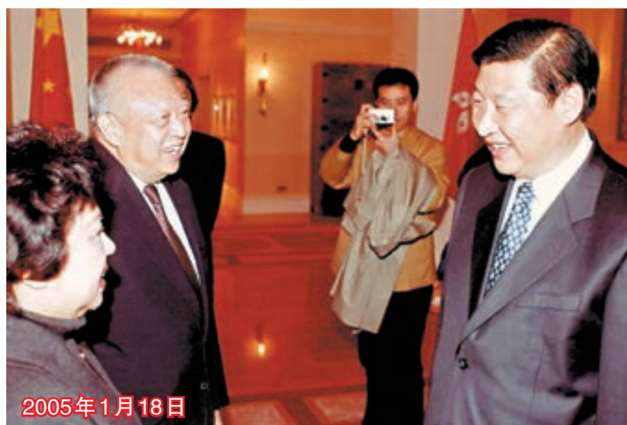
■時任浙江省委書記習近平（右）訪港，到禮賓府拜會時任特首董建華。

在香港最具競爭力的金融領域，得益於中央政府的大力支持，跨境人民幣業務蒸蒸日上，全球最大離岸人民幣業務中心的地位岌然不動。從2014年起陸續推出的「滬港通」、「深港通」以及今年5月獲批的「債券