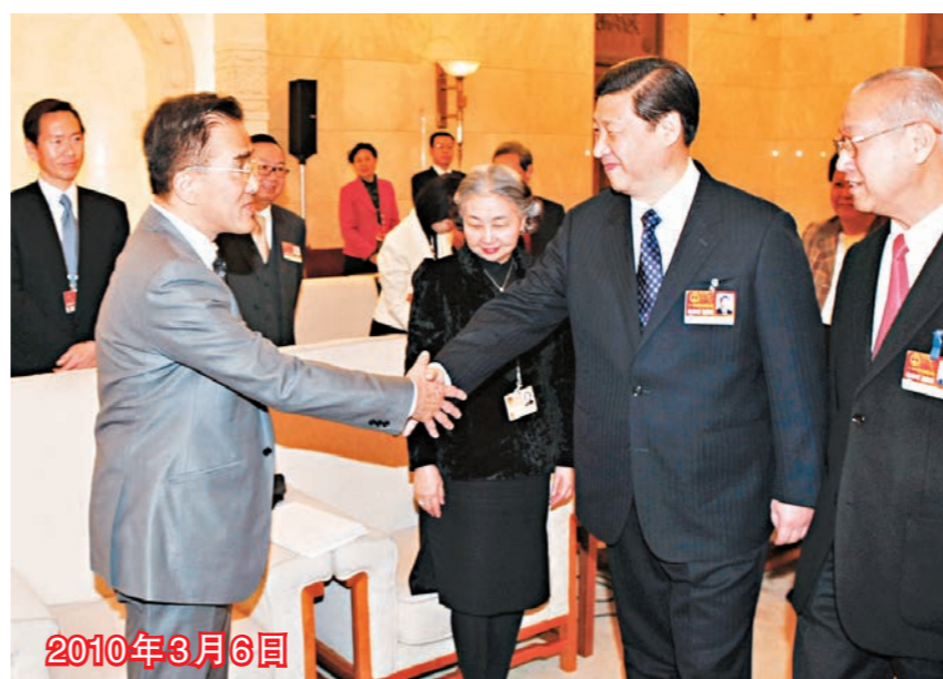
■時任國家副主席習近平在人民大會堂香港廳參加全國人大香港代表團的審議。