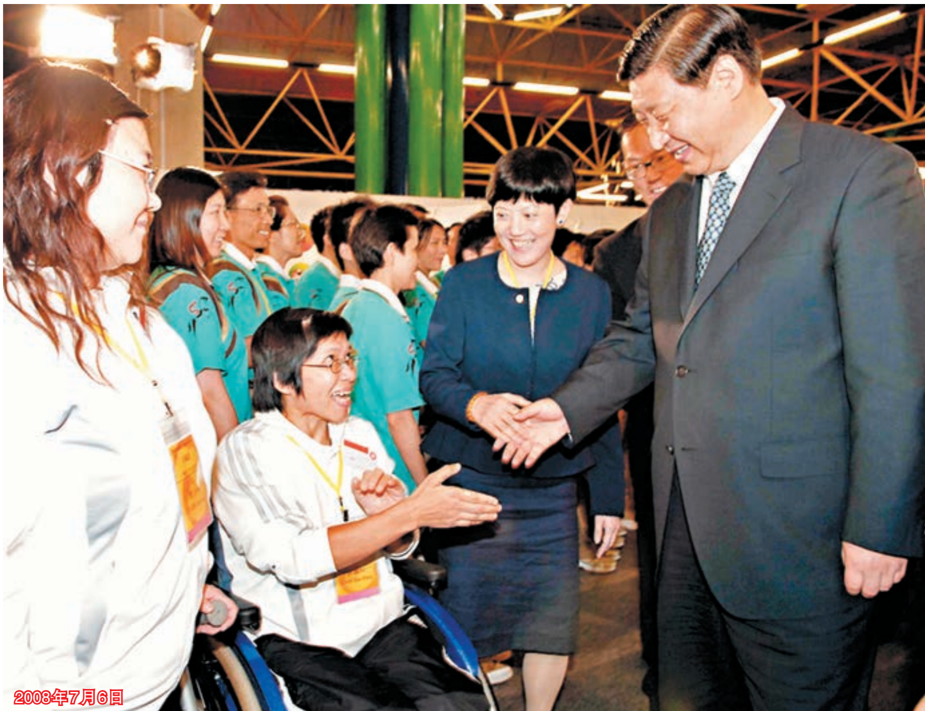
■時任國家副主席習近平在沙田奧林匹克大家庭貴賓廳會見香港運動員。