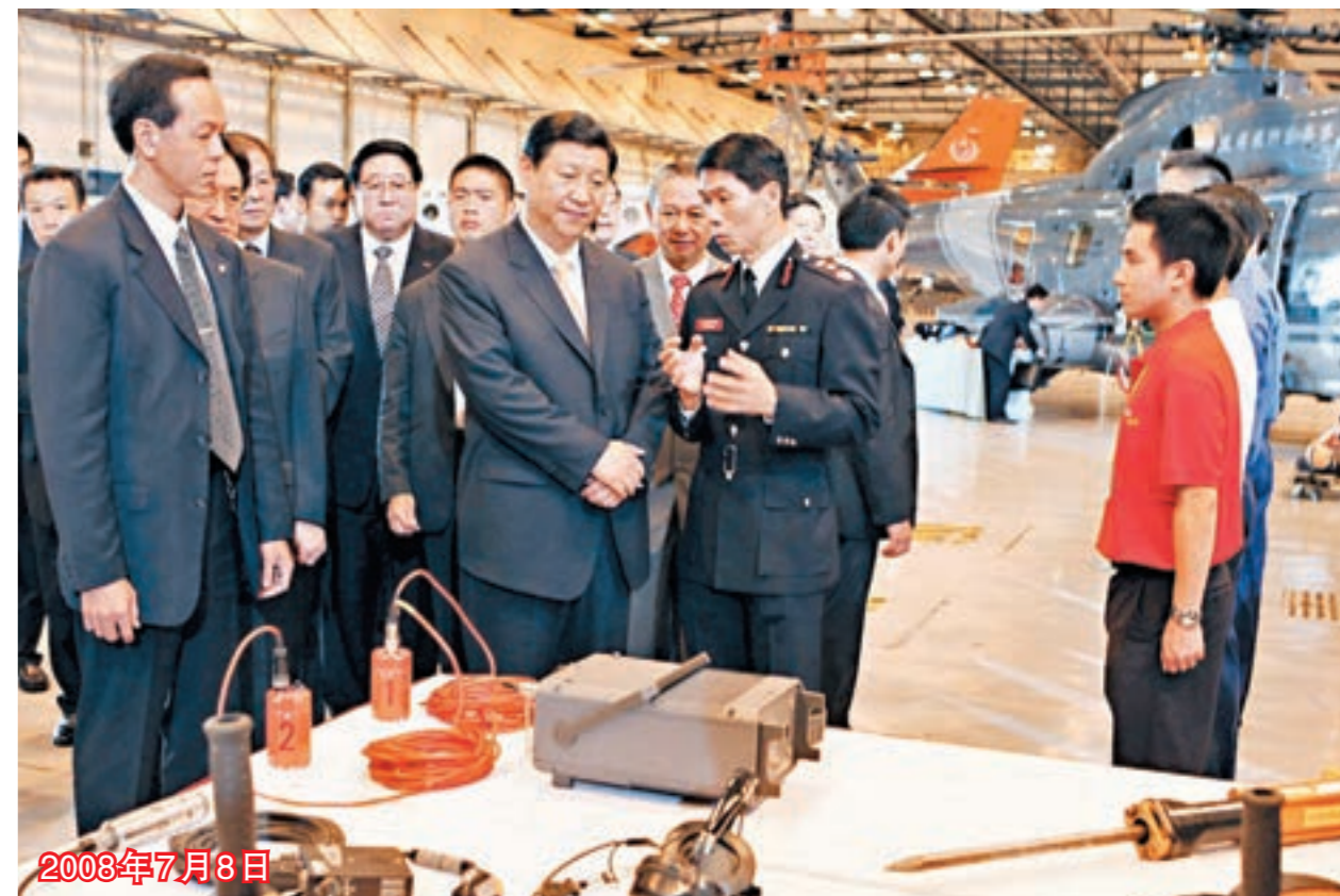
■時任國家副主席習近平探訪參加過四川抗災救災的香港拯救人員，參觀有關救災器材並聽取介紹。

20年，新的香江故事，剛剛翻開序章。（文章全文見文匯網www.wenweipo.com）