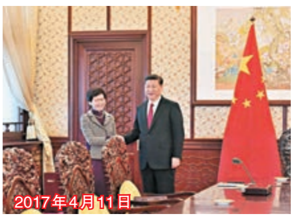
■國家主席習近平會見候任行政長官林鄭月娥。

到了新情況新問題，香港社會還有一些人沒有完全適應這一重大歷史轉折，特別是對「一國兩制」方針政策和基本法有模糊認識和片面理解。」