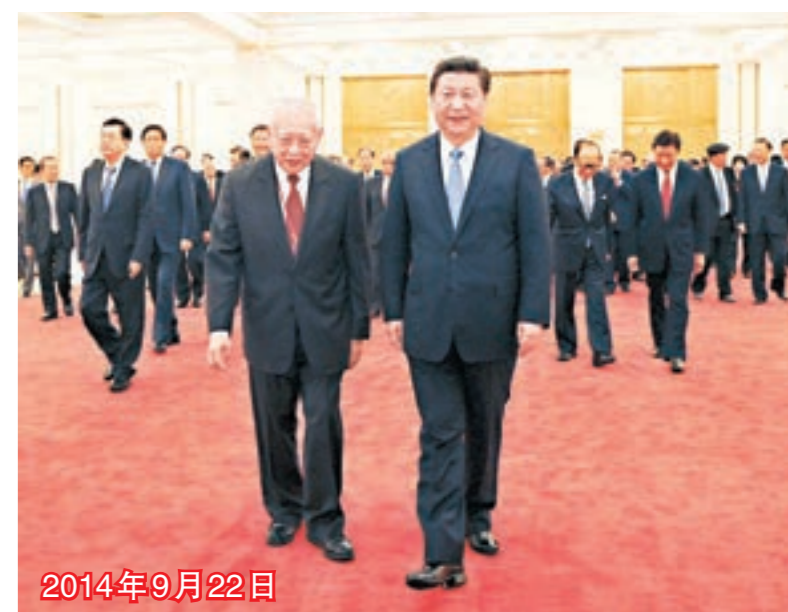
■國家主席習近平在北京人民大會堂會見香港工商專業界訪京團。