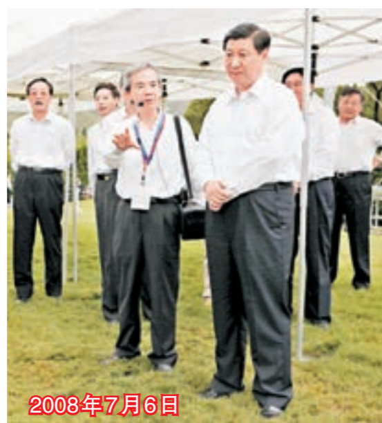
■時任國家副主席習近平視察香港雙魚河奧馬賽場。