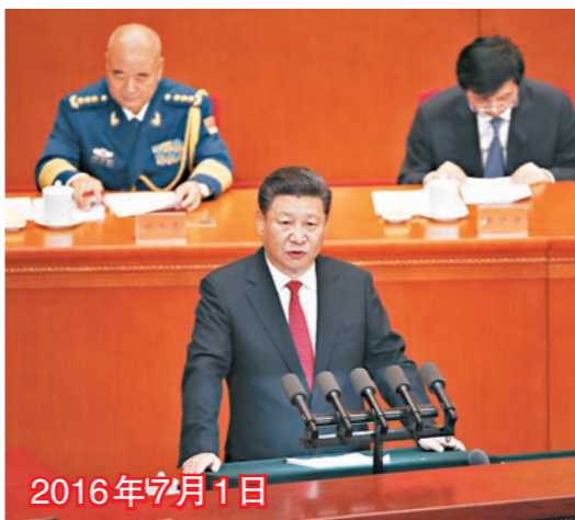
■習近平在建黨95周年大會上表示，支持香港發展經濟，改善民生，推進民主，促進和諧。