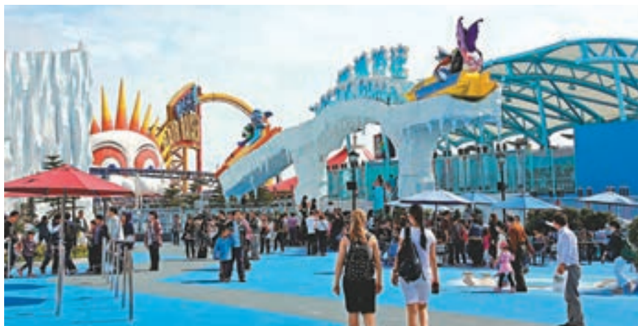
審題時需要看清楚題目要求，若寫「海洋公園眾生相」，最後寫成海洋公園遊記，就會變成離題了。資料圖片

總結而言，審題須慎密，取材也要適切，立意深刻，寫作就能突圍而出。當然，學生還要運用恰當的遣詞造句、佈局謀篇。篇幅所限，有關內容，下次再談。