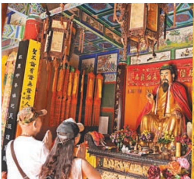
運籌帷幄本是指在軍帳中出謀劃策，出於《史記》中漢高祖讚揚張良的一段。圖為漢張留侯祠。

不過，筆者相信大器晚成非壞事。本學年，不少學生都有當領袖的潛能，只是還需要多一點點時間好好琢磨。所謂「羅馬非一天建成」，只要我們當老師的能多為他們作心理建設，幫助他們提升自信，而學生持守堅毅不屈的精神，努力不懈，繼續為自己的目標向前，假以時日，他們必成大器，成為你我眼中的美玉。