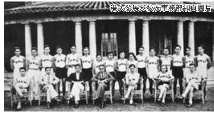
港大發展及校友事務部網頁圖片