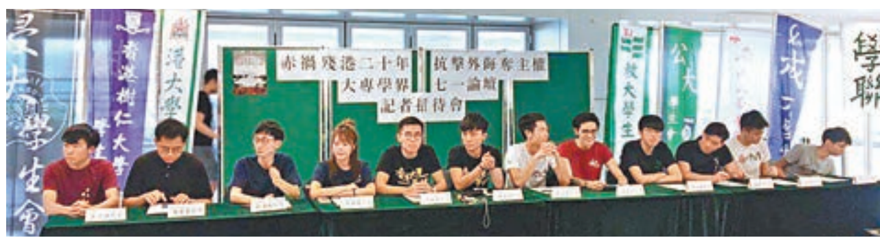
13所大專院校學生會及學聯昨聯署發出所謂「聲明」。

香港文匯報訊（記者 姬文風）香港即將迎回歸20周年，部分大專院校學生會卻乘機造謠生事，發出所謂「聲明」，字裡行間不斷散佈「白色恐怖」，甚至將香港基本法訂明「一國兩制」、「五十年不變」等事實逐一「篡改」，妄稱「香港淪為中國殖民地」，更用上二戰時期被日軍侵佔的「香港淪陷」字眼，對香港回歸祖國盛事極盡侮辱。聲明更鼓吹否定香港基本法及「一國兩制」，稱要「抗擊外侮，光復香港」，流露煽動「港獨」違法思想的意圖。教育界與政界人士齊聲感嘆，批駁他們顛倒是非黑白，對歷史事實毫無掌握，有失大學生身份。