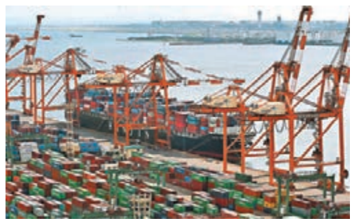
協定將加強日歐之間的貿易聯繫。圖為東京港口。

美國《紐約時報》前日報道，歐盟和日本將敲定歷來最大規模的自由貿易協定，最快本週宣佈達成協議，該協定將加強日歐雙方的貿易聯繫，或進一步孤立總統特朗普帶領下走上