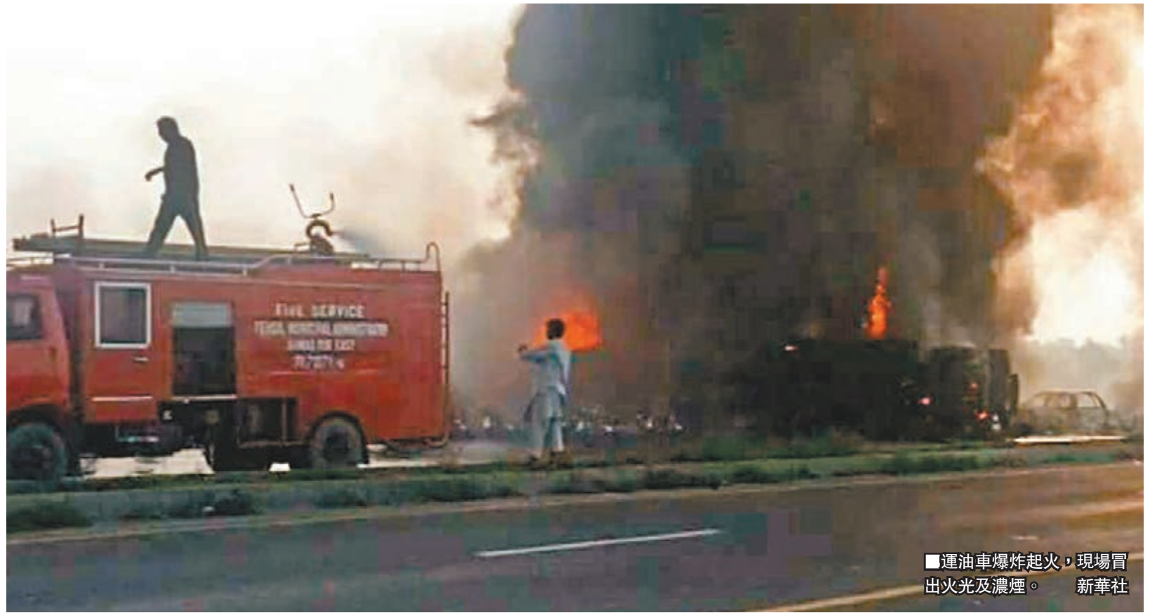
運油車爆炸起火，現場冒出火光及濃煙。