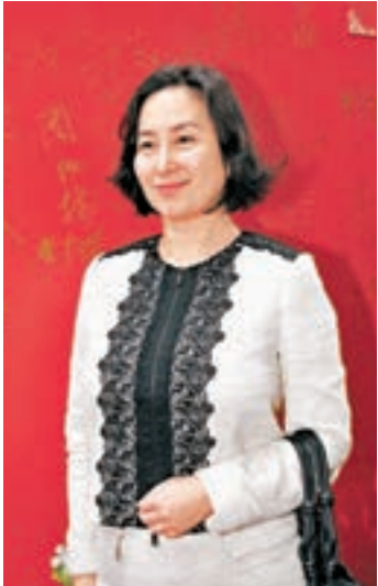
何超瓊將接任信德集團行政主席。圖為何超瓊。

(0880)主席兼執行董事。他近年身體欠佳，已減少公開露面，將旗下賭業王國傳予各房。除了二房長女何超瓊接掌信德集團，次子何猷龍現為新濠國際(0200)集團主席兼行政總裁；三房現持有部分澳門旅遊娛樂股份；而四太梁安琪則擔任澳博常務董事兼行政總監。