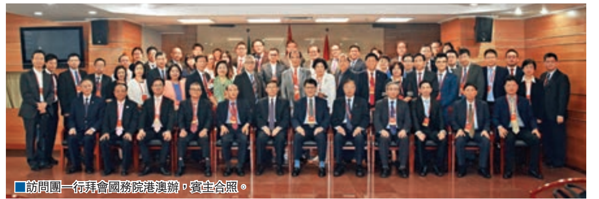
訪問團一行拜會國務院港澳辦，賓主合照。