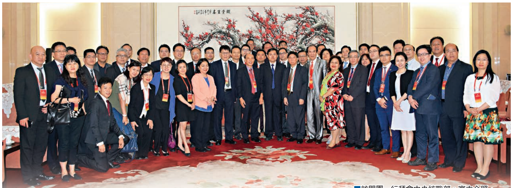
訪問團一行拜會中央統戰部，賓主合照。