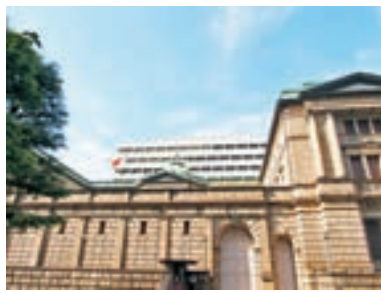
日本央行剛發表的政策會議記錄顯示，委員們同意購買國債規模會有波動。

美元兌日圓走勢，技術圖表而言，相對強弱指標及隨機指數已屆於超買區域，並有着初步的回落跡象，或見美元兌日圓近期的漲勢可能要稍緩一下。較近支持先參考25天平均線110.80，關鍵則在位於109.20的250天平均線，上周已見匯價守穩250天線，且於四月份匯