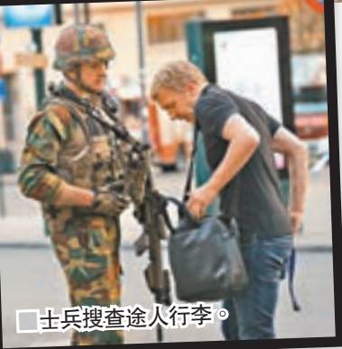
士兵搜查途人行李。