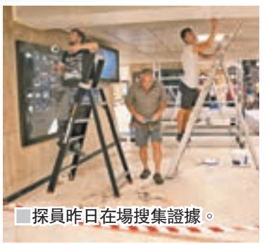
探員昨日在場搜集證據。