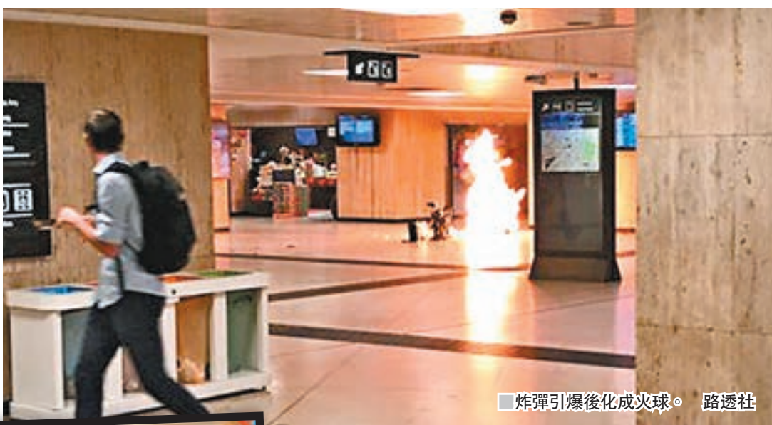
炸彈引爆後化成火球。