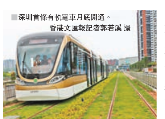
深圳首條有軌電車月底開通。

深圳首條有軌電車將於本月底在龍華試運營。目前車站設備調試均按計劃推進，所有站點的自動購票機已安裝完畢，全線將實行一票制，票價為2元人民幣/人次。乘客可直接使用「雲購票」方式。此外，車輛沿線的綠化帶將栽種鳳凰木、木棉和「中國紅」櫻花等11種植被，市民乘車時會有穿行花海之感。