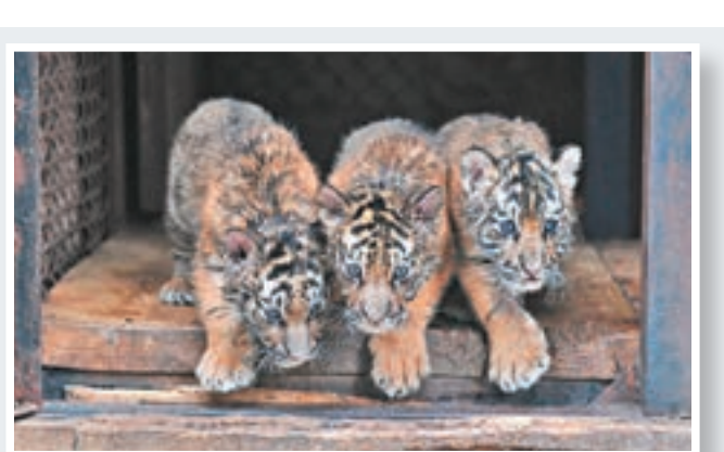
小虎滿月 雲南野生動物園的四胞胎東北虎近日迎來滿月，與遊客見面。圖為三隻小老虎昨日外出時步伐一致。文/圖：中新社