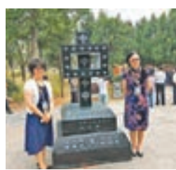
河南登封設立人類非物質文化遺產「二十四節氣」申遺成功紀念碑。

民間禮拜周公、天文愛好者「測日影」、群眾千人同吃夏至麵...6月21日，是「二十四節氣」申報人類非物質遺產成功後第一個夏至日，登封「二十四節氣——夏至登封「測日影」系列傳統文化活動」在河南登封市告成鎮觀星台景區啟動，數萬人參與活動。