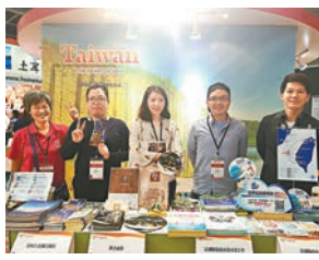
金門和澎湖的業者