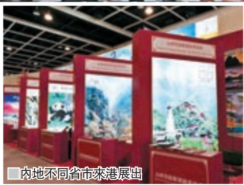
內地不同省市來港展出

一年一度的香港國際旅遊展日前圓滿結束，今年旅展聚焦高端旅遊及推廣主題遊等，專業日吸引逾一萬二千名區內買家、旅遊界和業界觀眾，當中超過25%來自中國內地及其他海外地區，而公眾日預計有九萬人次，約85%喜以自由行或私人包團方式外遊。就筆者所見，中國國家旅遊局設有攤位，當中以廣東旅遊最吸引港人，而台灣地區團聲勢浩大，一展集合各地旅遊名城，氣勢不差。不少航空公司亦推出機票優惠，在指定日子前購票即可享優惠，讓你暑假旅遊更超值。