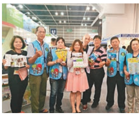
宜蘭民宿協會業者

至於對台中而言，反而推廣2018年的台中世界花卉博覽會，宣揚遊「台中·賞花博」的旅程，以六大旅遊主題：生態、宗教、運動、慢活、時尚、人文等作為深度遊，而花博則以外埔水豐園區、后里馬場森林園區、豐原葫蘆墩公園三地，設置綠能館、自然館、花藝館、發現館、探索館、花饗館等，讓愛花人深度遊台中。