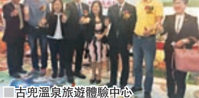
古兜溫泉旅遊體驗中心

有別於其他溫泉，當地以「一地兩泉」而聞名，溫泉谷分為鹹溫泉及淡溫泉，能促進血液循環，放鬆心情之餘更能帶走港人的生活壓力。今年，廣州長隆水上樂園演藝陣容亦升級，一眾歐美藝術家為遊客獻上充滿激情的全新超大型日間演藝派對——嬉水派對。由世界冠軍水上飛人團隊領銜，備受好評的美國London Hill樂隊、