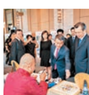
西安市委書記王永康介紹西安旅遊魅力

泰州是《水滸傳》作者施耐庵、揚州八怪代表人物鄭板橋、京劇藝術大師梅蘭芳的故鄉。加上，抗金英雄岳飛、政治家文學家范仲淹、書畫大師齊白石等曾在泰州或主政或從業，自然留下一些名勝古蹟、古建築、古石刻等，省市級文物保護的古蹟有百多處，全市建有5座博物館，珍藏文物萬件，不少為稀世珍品。日涉園、崇儒祠、岳王廟、安定書院、施耐庵陵園、鄭板橋故居、梅蘭芳紀念館柳園等人文景觀俱是泰州歷史文化的瑰寶，值得觀賞。