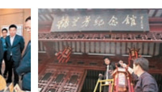
梅蘭芳紀念館 新華社