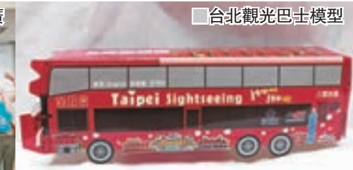
台北觀光巴士模型

同時，暑假腳步接近，台東縣政府發出號召令「暑假啟動 直飛台東」，邀請大家到台東，進行一場「動感台東 熱力升空」盛夏之旅。台東縣長黃健雄帶領著縣府團隊前來香港，親自把台東的美麗風光，以及豐富好玩的旅遊活動，包括將在6月30日到8月6日舉辦的國際熱氣球嘉年華、光雕音樂會等，介紹給香港朋友。而香港一台東直航航班從7月14日起正式啟動，每逢周二、五包機限定直航航班，共計26架次，可讓1,300多位香港旅客深度遊台東。高雄市政府觀光局今年以「高雄夏Party」