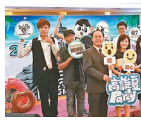
高雄市政府觀光局以「高雄夏Party」為主題