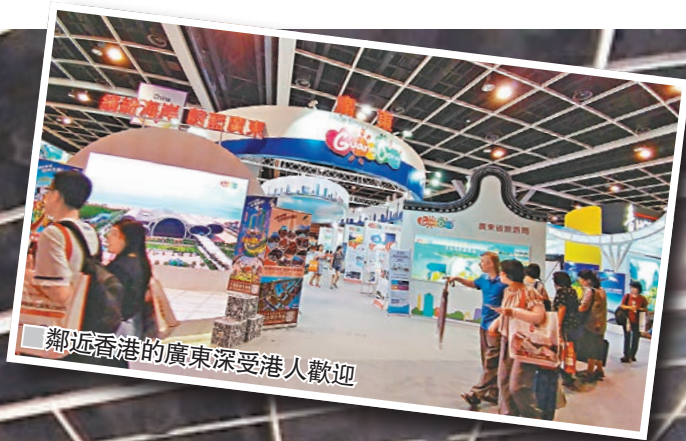
鄰近香港的廣東深受港人歡迎