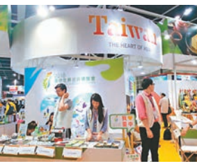
台中推廣下年的花博展覽