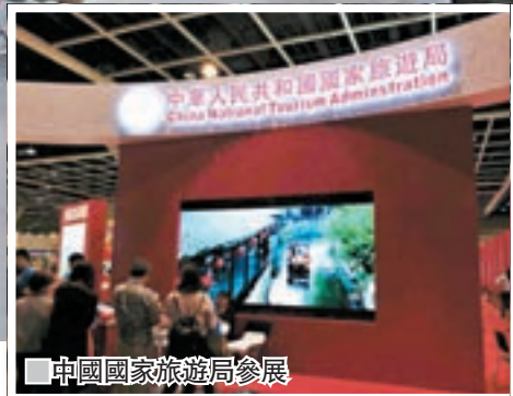
中國國家旅遊局參展