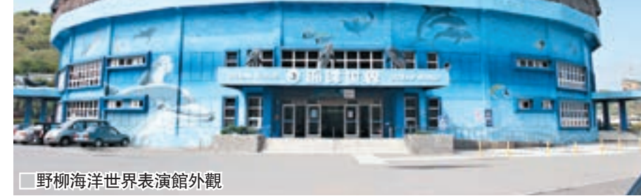
野柳海洋世界表演館外觀