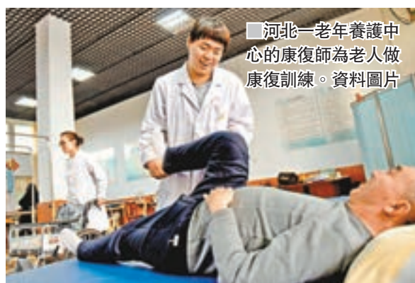
河北一老年養護中心的康復師為老人做康復訓練。

三是加大政策扶持，落實好國家支持保險和養老服務業發展的相關財稅政策，加快個人稅收遞延型商業養老保險試點，支持商業養老保險機構有序參與基本養老保險基金投資管理，為商業養老保險資金參與國家重大項目和民生工程建設提供綠色通道和優先支持。加大監管力度，督促保險機構提高服務質量，維護消費者合法權益，切實防控風險。