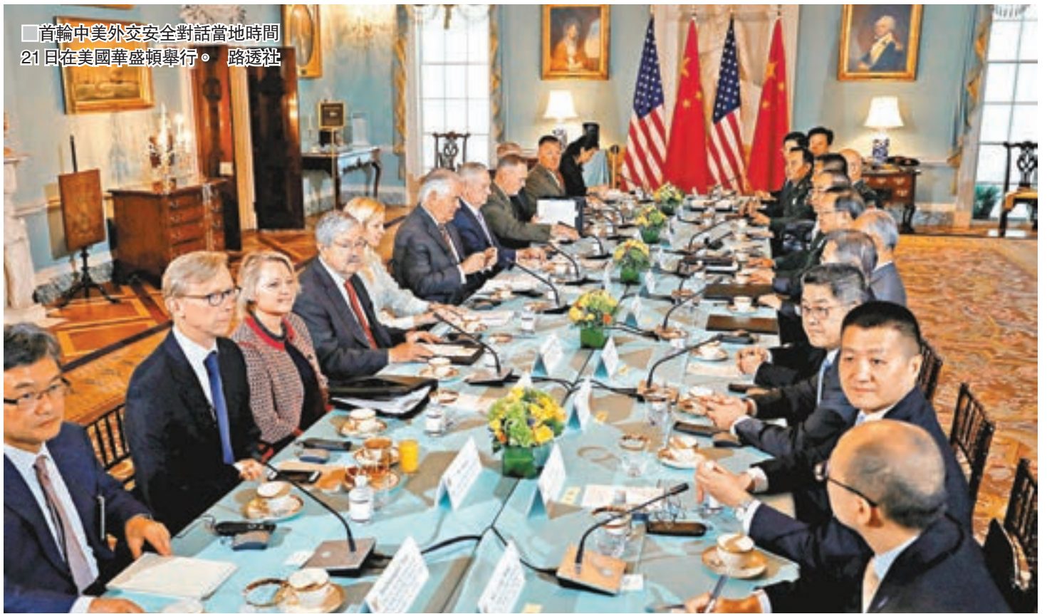
首輪中美外交安全對話當地時間21日在美國華盛頓舉行。

美國國務院代理助理國務卿蘇珊·桑頓表示，美國希望首輪中美外交安全對話能夠繼續兩國元首在海湖莊園會晤的積極勢頭，加深雙方溝通交流，並在優先議題上取得進步。桑頓說，我們相信雙方可以通過此次對話取得具體成果，並有助於加深雙方在相關議題上的相互了解。