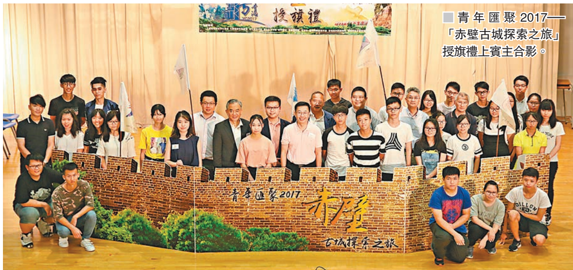
青年匯聚2017——「赤壁古城探索之旅」授旗禮上賓主合影。

是次旅程完結後，主辦單位亦會安排參與交流團的湖北學生於7月底回訪香港，將安排內地青年參觀本港的政府辦公機構及學校，與香港學生交流，以及於香港共同進行義務工作等。希望通過在義務工作彼此交流、體驗香港校園生活、進行社會服務及考察歷史古蹟等方式推動兩地青年在多領域的交流。