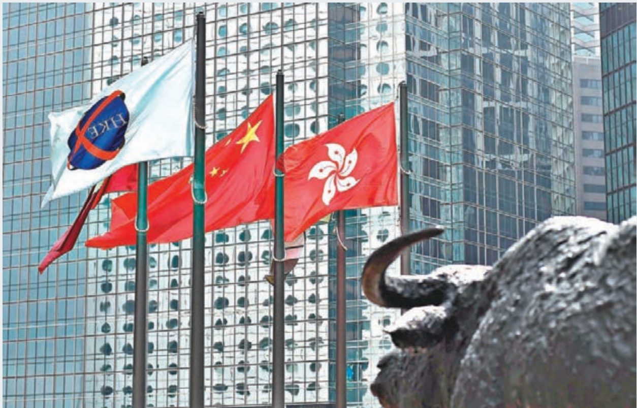
市場睇好A股成功「入摩」,令港股重新注入活力,港交所昨日造好。

香港文匯報訊(記者周紹基)投資者關注A股本周三能否獲納入MSCI新興市場指數,令港股重新注入活力,全日高開高走,一度最多升過313點,距26,000點大關只差60點,最終仍升298點報25924點,升幅達1.2%,一洗上周累跌403點的頹氣。國指更跑贏大市,全日升1.3%報10,520點,但成交額卻縮減至664億元,未能配合升勢,顯示投資者對周三A股能否順利「入摩」,未有很大的信心。