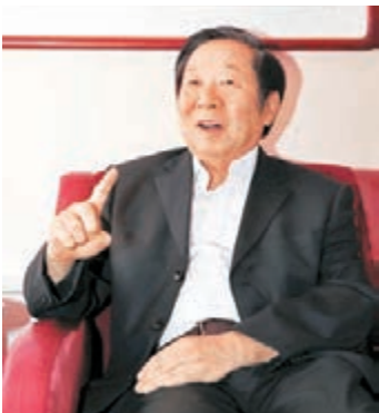
■陳佐洱表示，「一國兩制」是保持香港長期繁榮穩定的最好制度安排。

香港文匯報訊（記者 陳庭佳）國務院港澳辦原常務副主任、全國港澳研究會創始會長陳佐洱近日接受中新社訪問時表示，「一國兩制」已被證明是香港和平回歸祖國的最佳辦法，也是保持香港長期繁榮穩定的最好制度安排，取得了舉世公認的成功，但要留意正在逐步顯露的深層次問題，包括發展落後於鄰近地區。