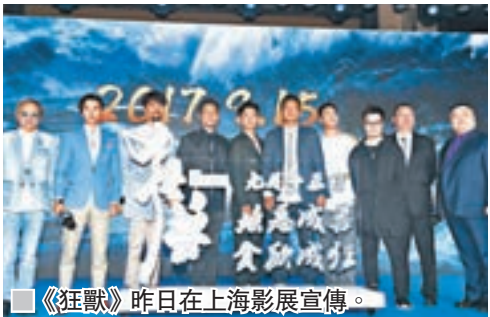
■《狂獸》昨日在上海影展宣傳。

眾不停在罵，總有一天觀眾會背棄我們，因不是觀眾的喜愛。市場上泡沫愈來愈大，所以作為創作者，有時票房走低我覺得也是好事，讓大家謹慎些。好像很多香港導演拍合拍片，提出要「接地氣」，但我覺得有時為了「接地氣」而去盲目和應，失去本意。一套好的電影，不論你放在任何地方，觀眾都看得明。我們不需要所有票房，我們更需要觀眾的支持。」