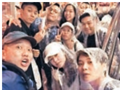
■雖然未能順利出發，不過柏豪(左上角)等人仍樂觀面對。