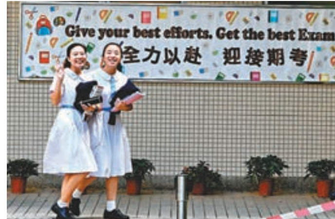
林鄭表示將爭取50億元教育撥款在新學年開始前落實。資料圖片