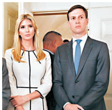
■庫什納的個人財務及生意來往受調查。圖為庫什納夫婦。