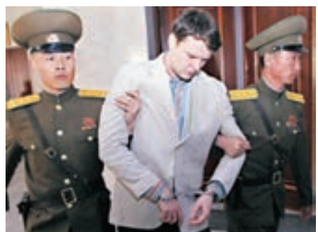
■瓦姆比爾去年在朝鮮出庭。

獲朝鮮釋放返回美國的大學生瓦姆比爾，醫院證實他腦部和神經系統嚴重受損，不能夠講話，對外界的刺激全無反應，處於植物人狀態。他的父母前日召開記者會，指責朝鮮虐待兒子，並以戰犯一樣的方式將他關押。