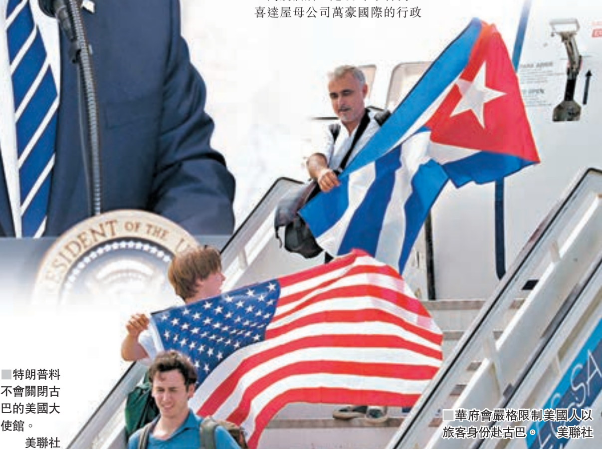
■華府會嚴格限制美國人以旅客身份赴古巴。