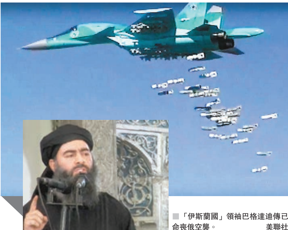
■「伊斯蘭國」領袖巴格達迪傳已命喪俄空襲。