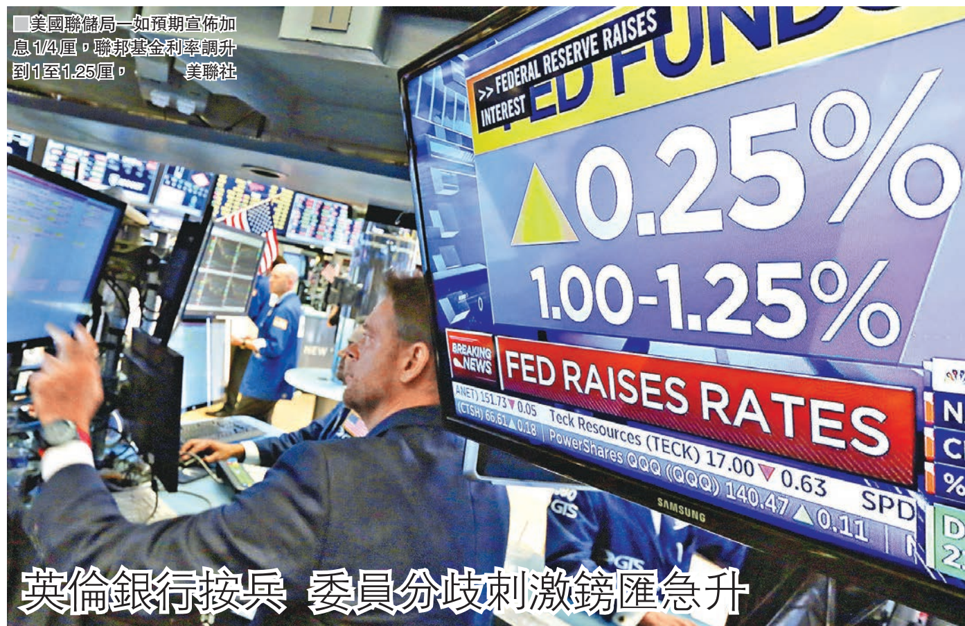
英倫銀行接兵 委員分歧刺激鎊匯急升

英倫銀行昨日議息後，宣佈維持利率在 0.25 厘不變，但貨幣政策委員會的意見分歧超出預期，8 名委員當中，有多達 3 名委員支持加息，意味下次會議加息的機會大增。受消息影響，英鎊匯價應聲由 1.27 美