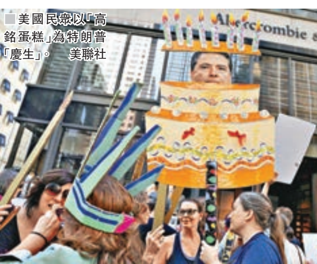
美國民眾以「高銘蛋糕」為特朗普「慶生」。