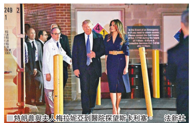
特朗普與夫人梅拉妮亞到醫院探望斯卡利塞。