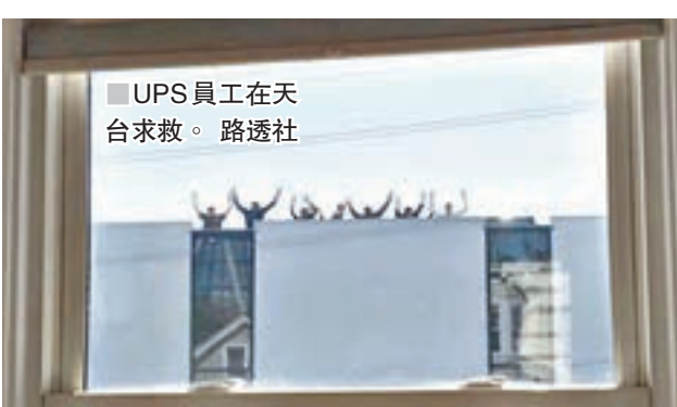
UPS 員工在天台求救。