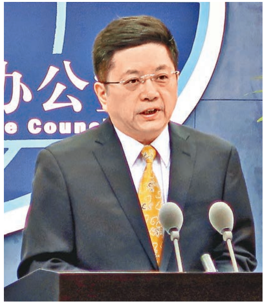
馬曉光指「台獨」和「港獨」的圖謀和行徑不會得逞。