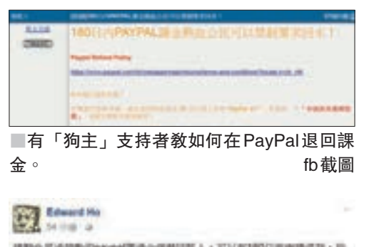
有「熱狗」支持者教如何在PayPal退還課金。fb截圖