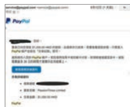
有網民展示電郵,稱自己成功經由PayPal取回自己捐給《熱時》的款項。