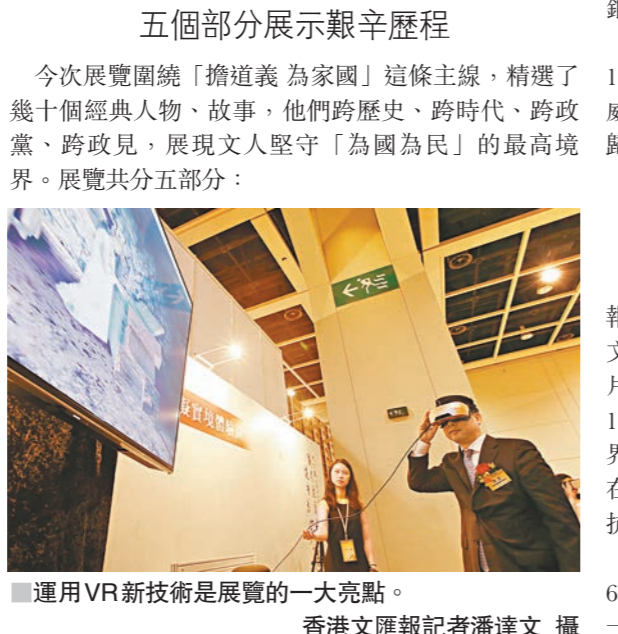
運用VR新技術是展覽的一大亮點。

【特寫】「鐵肩擔道義 健筆為家國——《大公報》創刊115周年大型圖片展」，其中一個亮點是運用最新科技，以VR、AR的技術，讓觀眾體驗大公報人在防空洞中辦報的情景。昨日眾主禮嘉賓張建宗、陳茂波、梁愛詩等也都嘗試體驗一下這項最新技術，並親臨其境當一回「大公報人」。 感受日軍飛機狂轟濫炸 昨日開幕式後，張建宗等眾嘉賓在姜在忠陪同下參觀展覽，當他們行至虛擬實境體驗區時，難掩好奇心，戴上AR頭戴式顯示器，體驗在重慶時期，面對敵機轟炸，大公報人依舊堅持在防空洞中辦報及日本在密蘇里戰艦上簽署投降書的珍貴情景。