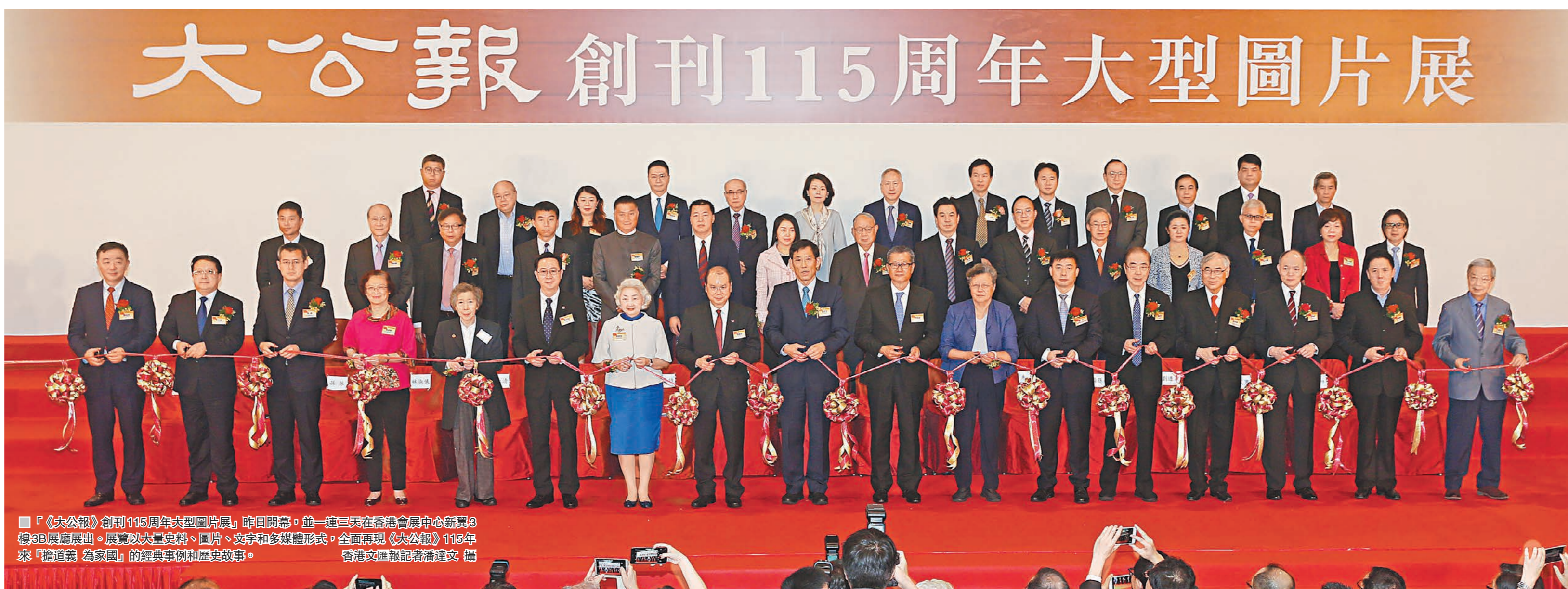
《大公報》創刊115周年大型圖片展昨日開幕，並一連三天在香港會展中心新翼3樓3B展廳展出。展覽以大量史料、圖片、文字和多媒體形式，全面再現《大公報》115年來「擔道義 為家國」的經典事例和歷史故事。