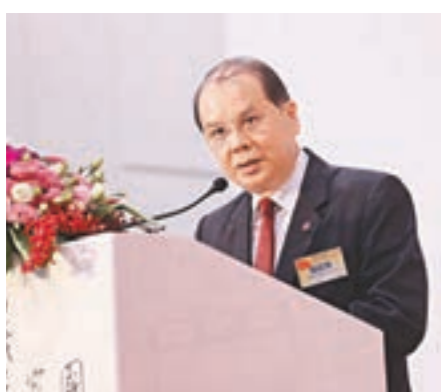
張建宗致辭。

香港文匯報訊（記者 沈清麗、邵萬寬、鄧學修、李學）「鐵肩擔道義 健筆為家國——《大公報》創刊115周年大型圖片展」昨日隆重開幕，一連三天在香港會展中心新翼3樓3B展廳展出，以大量史料、圖片和文字及多媒體形式，全面再現《大公報》115年來「擔道義 為家國」的經典事例和歷史故事。政務司司長張建宗、財政司司長陳茂波、全國人大常委范徐麗泰、全國人大常委會香港基本法委員會副主任梁愛詩、中聯辦宣傳文體部部長朱文、發展局局長馬紹祥等主禮，香港大公文匯傳媒集團董事長姜在忠、副董事長李大宏、副董事長兼總經理歐陽曉晴、董事姜亞兵，與主禮嘉賓一起為展覽剪綵。