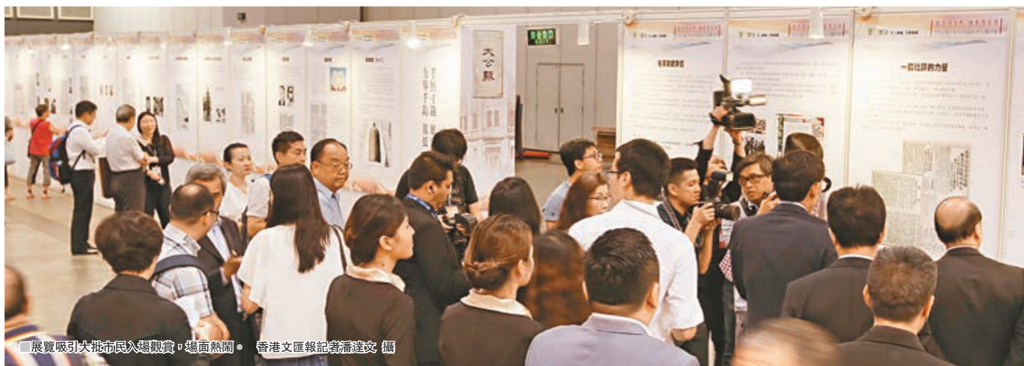
展覽吸引大批市民入場觀賞，場面熱鬧。

張建宗致辭指，《大公報》是現今香港歷史最悠久的中文報章。傳媒的天職是記述事實，見證歷史；在時間的洗禮下，《大公報》也已成歷史的一部分，並且發揮著重要的影響力。《大公報》以「忘己之為大，無私之謂公」為辦報宗旨，創辦115年來一直大公無私、為家為國。 張建宗：「新聞界黃埔軍校」人才輩出 他續指，《大公報》被譽為「新聞界的黃埔軍校」，名人輩出。著名作家蕭乾是二次世界大戰期間唯一駐守歐洲的中國記者，還有胡適、林語堂、曹禺、沈從文、豐子愷、費孝通、國畫大師黃永玉、武俠小說兩大宗師金庸和梁羽生等等。「當然還有我的特區政府舊同事，前民政事務局局長曾德成，人才輩出。」 他表示，《大公報》肩負著歷史的傳統，同時承載著創新的使命。去年，《大公報》與《文匯報》整合重組，順應媒體融合發展的新潮流。今年是香港回歸祖國和特區成立20周年，是彰顯「一國兩制」在香港成功推行的重要里程碑，他期望《大公報》繼續為國為民，筆錄歷史，與特區政府攜手建設香港，一同向前邁進。