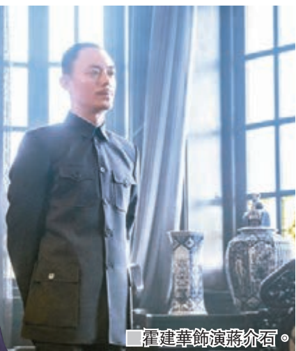
霍建華飾演蔣介石。