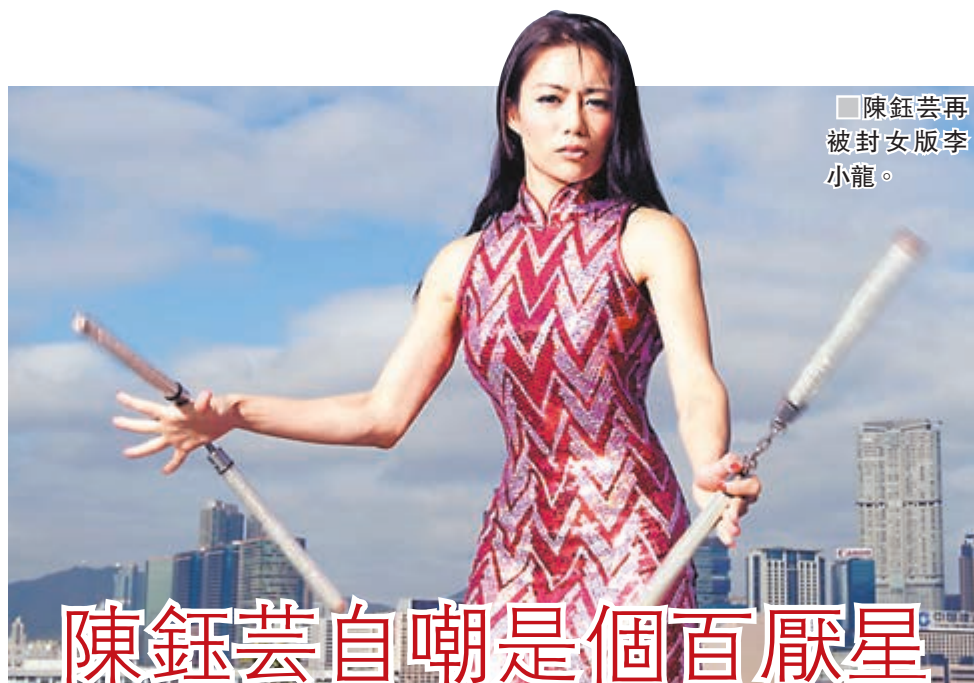
陳鈺芸再被封女版李小龍。