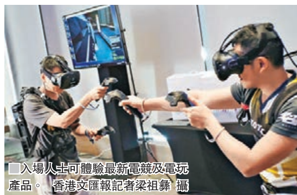
入場人士可體驗最新電競及電玩產品。