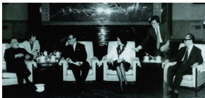
鄧小平會見鍾士元、鄧蓮如、利國偉，語重心長地希望香港各界要在過渡期防止出現大的波瀾，同時創造條件順利接管政權。

1985年4月10日，六屆人大三次會議通過決定，成立香港特別行政區基本法起草委員會，負責根據中英聯合聲明的12條指導方針，將香港特別行政區內實行的制度用法律規定下來。1985年6月18日，人大常委會通過了59人組成的起草委員會名單，其中內地委員36人，香港委員23人。主任委員為時任國務院港澳辦主任姬鵬飛，八名副主任委員中有四名是港人，分別為：