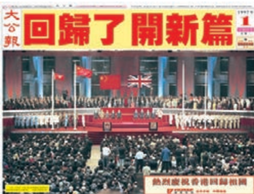
《大公報》的慶回歸對開跨頁頭版，一圖勝千文，六個字盡表心聲。

7月1日早晨的《大公報》，用16個版面，從「末屆總督」彭定康告別官邸，到香港市民夾雨夜道歡迎駐港解放軍進城，濃墨重彩、酣暢淋漓地從不同角度報道香港回歸日。最給人留下印象的，是橫跨封面封底的全張照片，一圖勝千文地刊出回歸夜主權移交最經典的一