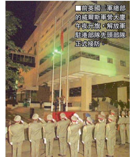
前英國三軍總部的威爾斯軍營大廈午夜升旗，解放軍駐港部隊先頭部隊正式接防。

政權交接的盛大儀式之後，又是另一場盛典——香港特別行政區成立儀式。凌晨1時30分，國家主席江澤民宣佈香港特別行政區正式成立，然後是第一任特區行政長官宣誓就職，政府高級官員、行政會議成員、臨時立法會議