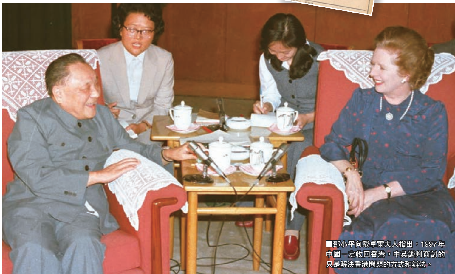
鄧小平向戴卓爾夫人指出，1997年中國一定收回香港，中英談判商討的只是解決香港問題的方式和辦法。

同年12月28日，中英聯合聲明在北京正式簽字。香港各界逾百人獲邀上京觀禮。《大公報》當日出「號外」，第一時間報道中英聯合聲明簽定。