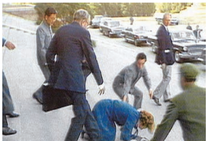
戴卓爾夫人在與鄧小平會談後，心神恍惚，在人民大會堂的石級上摔了一跤，成了中英圍繞香港前途角力中最具象徵意味的存照。

員、終審法院常任法官和高等法院法官陸續宣誓，而在會場外不遠處的添馬艦軍營，解放軍駐港部隊也完成了香港防務的交接……回歸日的夜晚，《大公報》報館的燈光通宵明亮。忙了一日一夜的《大公報》記者，轉眼又投身到香港特別行政區成立首日的報道工作中。從6月30日傍晚到7月1日晚，《大公報》在二十多個小時內創紀錄地連出四次「號外」。興奮使人們忘記了勞累，這是這一代大公報人最意氣風發、自豪的一天。