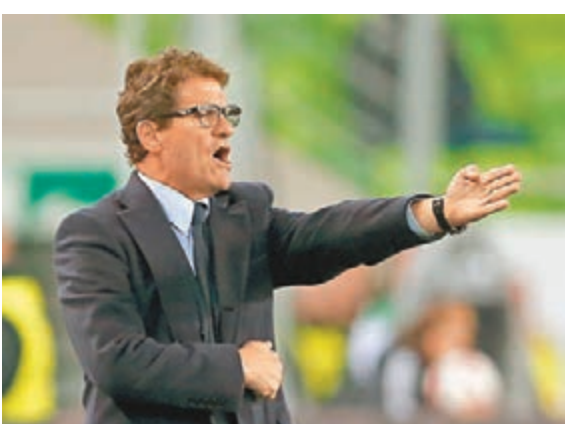
卡比路加盟中超球隊江蘇蘇寧。資料圖片

江蘇蘇寧足球俱樂部正式與法比奧·卡比路(Fabio Capello)先生簽約。即日起，卡比路先生將作為江蘇蘇寧足球俱樂部主教練，率隊征戰各項賽事。作為世界足球壇最成功的主帥之一，卡比路先生曾執教過包括AC米蘭、皇家馬德里、羅馬、祖雲達斯等在內的多家世界頂級俱樂部，率隊贏得過5次意甲冠軍、2次西甲冠軍、4次意大利超級盃、1次歐洲超級盃及1次歐洲冠軍盃。此外，他還曾先後出任英格蘭及俄羅斯國家隊主帥。簽約卡比路先生是蘇寧足球俱樂部根據自身戰略發