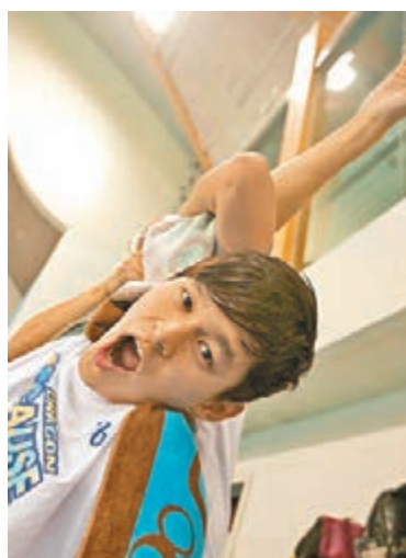
孫楊在訓練中進行熱身運動。

國際奧委會日前宣佈，東京奧運會的项目增加「新夥伴」，其中包括男子800米自由泳、女子1500米自由泳以及4X100米男女混合泳接力。對此，中國游泳第一人孫楊表示：「這是激勵和挑戰。我的大滿貫目標又升級了。」