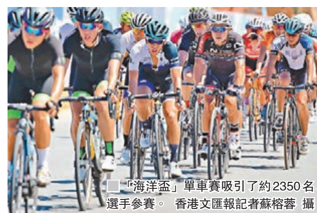
「海洋盃」單車賽吸引了約2350名選手參賽。

香港文匯報訊(蘇榕蓉 福州報導)「海洋盃」中國·平潭國際單車公開賽昨在平潭綜合試驗區龍頭海濱廣場開賽。賽事共吸引了來自全國各地以及美國、英國、德國、加拿大、俄羅斯、蒙古、台灣、香港等23個國家和地區約2350名選手報名參賽，再創比賽報名人數規模紀錄。