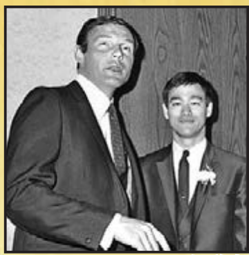
Adam West(左)曾與李小龍合作。

《蝙蝠俠》早於1940年代已經兩度改編成電影，1966年美國廣播公司(ABC)首度將這位超級英雄放進公仔箱，並由 Adam 主演。雖然該劇只拍了3季便在1968年結束，卻掀起熱潮。Adam 的布魯斯韋恩充滿正面陽光氣息，劇集中更經常加入「Bam!」「Whap!」等漫畫擬聲字，與近年電影的「黑夜之神」(The Dark Knight)形象截然不同，就連 Adam 也笑言自己是「光明之神」(The Bright Knight)。