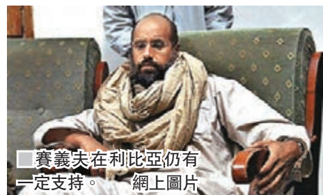
賽義夫在利比亞仍有一定支持。