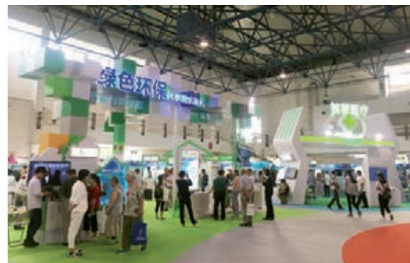
中關村綠色環保展區

統產業升級、構建「高精尖」經濟結構、完善創新創業生態的優勢和成效，大力宣傳示範區在踐行創新、協調、綠色、開放、共享的發展理念，積極搶佔全球科技創新競爭制高點方面取得的新成果和新突破，彰顯示範區在承載和支撐全國科技創新中心建設中的重要地位和作用。