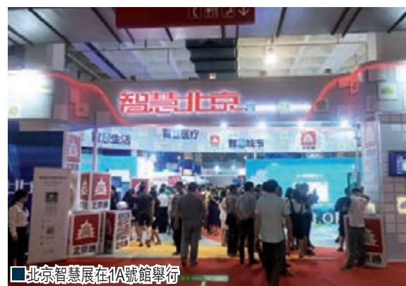
北京智慧展在1A號館舉行

記者在「智慧北京展」展廳看到，觀眾公眾可通過關注微信公眾號，參與智慧北京展「尋寶遊戲」，實現展館內各展示區域導覽介紹功能的同時收集「寶物」領取獎品，深入體驗遊覽等，行車途中就能通過智能平台了解目的地空餘車位數量和位置，高速WiFi覆蓋每個角落已不僅僅是美好的憧憬，它已慧及萬家，便捷百姓生活。