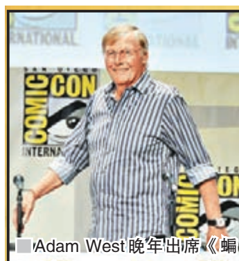
Adam West 晚年出席《蝙蝠俠》宣傳活動。

曾於1966年電視版《蝙蝠俠》中飾演蝙蝠俠的美國老牌影星 Adam West，前日因白血病在洛杉磯家中逝世，享年88歲。與後來荷里活改編