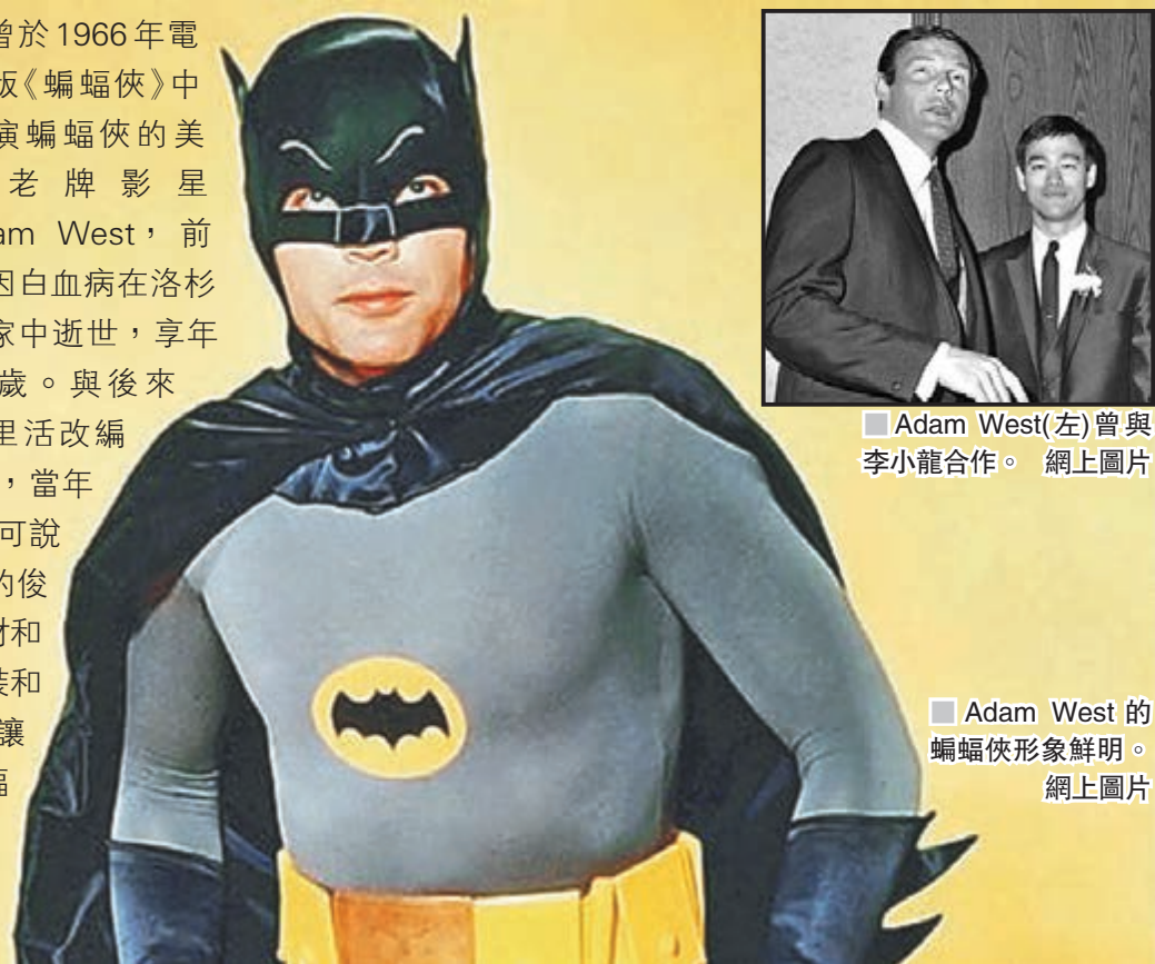
Adam West 的蝙蝠俠形象鮮明。

電影強調蝙蝠俠黑暗一面不同，當年 Adam 扮演的「第三代」蝙蝠俠可說充滿喜劇感，他沒有佐治古尼的俊俏，沒有基斯頓比爾的肌肉身材和冷酷深沉，但略為不稱身的服裝和兒戲的打鬥場面，卻足以讓 Adam 成為「獨一無二」的蝙蝠俠，堪稱整整一代人的回憶。他亦曾在1966年電影《青蜂俠》裡，與武打巨星李小龍合作。