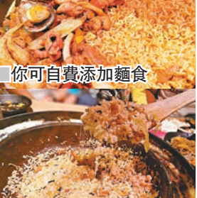
你可自費添加麵食