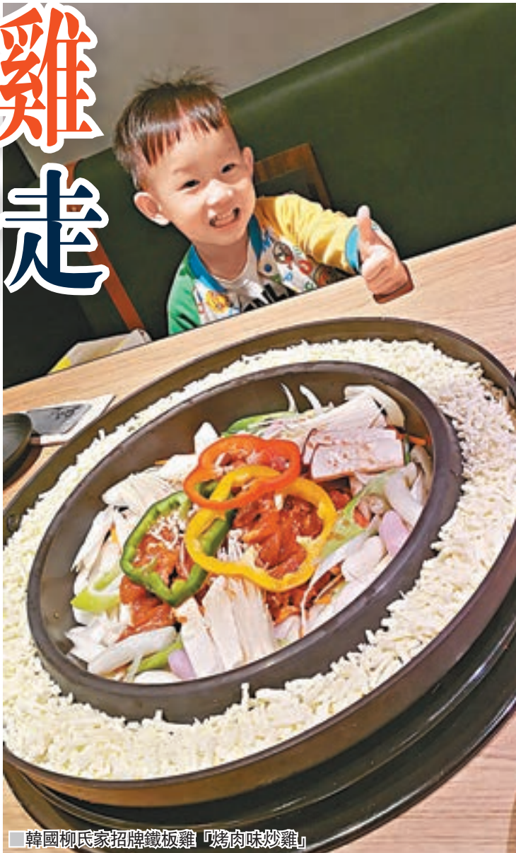
韓國柳氏家招牌鐵板雞「烤肉味炒雞」

筆者品嚐的是「烤肉味炒雞」，辣度最小，屬甜中帶微辣，嚐得出韓國傳統烤肉味道，微微焦香的烤雞肉，配搭濃郁醬汁，讓您每一口也吃得到香濃的烤肉風味。肉汁豐富口感軟嫩的雞柳，配合旁邊多款蔬菜配料一同於熱辣的鐵板煎炒，發出令人欲罷不能的香氣，令雞肉的美味瞬間提升。