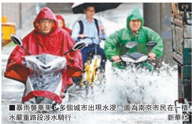
■暴雨襲華東，多個城市出現水浸。圖為南京市民在積水嚴重路段涉水騎行。

香港文匯報訊 綜合記者夏微、陳旻及中新社報道，華東地區昨天迎來入汛後第一場暴雨，上海中心氣象台先後發佈雷電黃色預警信號及暴雨黃色預警信號，截至昨日下午6時，虹橋機場出港航班取消89架次，進港航班取消75架次。上海部分區縣因短時強降水現「看海」、「成河」情景。