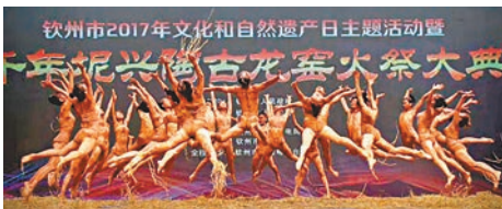
■《窯變千彩》將欽州坭興陶製作精髓用舞美展現。

香港文匯報訊(特約通訊員 呂品紅雲 廣西報道)一名名為《窯變千彩》的現代舞昨日在廣西欽州正式公演。欽州是古代海上絲綢之路的重要港口，這台現代舞以其千年古龍窯為背景、以絳紅色的大地為舞台，隨後還將在南寧、北海等地巡演。