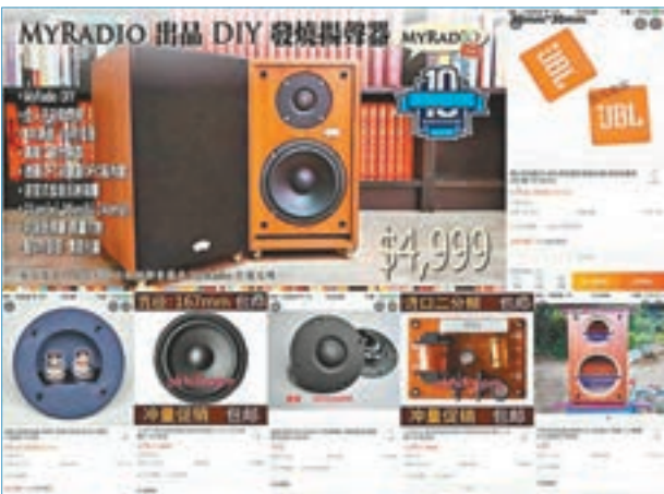
■賣台近5,000元的揚聲器被網民質疑只值400元人仔，食水太深。網上截圖

拿畫展標誌一事：「唔係呀嘛？賣台唔係大把錢又好多人材既（嘅）咩？做乜搞到好似香港中箭（『香港眾志』）果（啲）班濕×咁樣抄logo呀？10週年台慶竟然要用一個抄返黎（嚟）既（嘅）logo咁折厘！」