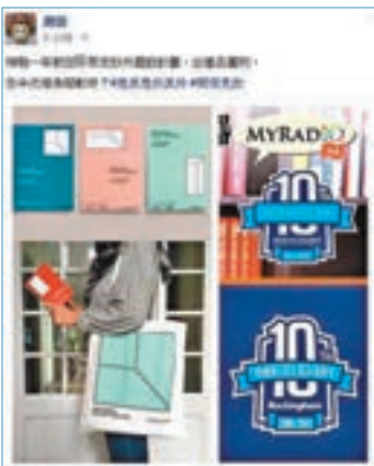
■賣台的10周年logo，被網民指與英國Rockingham賽車場在2011年的logo一模一樣。網上截圖