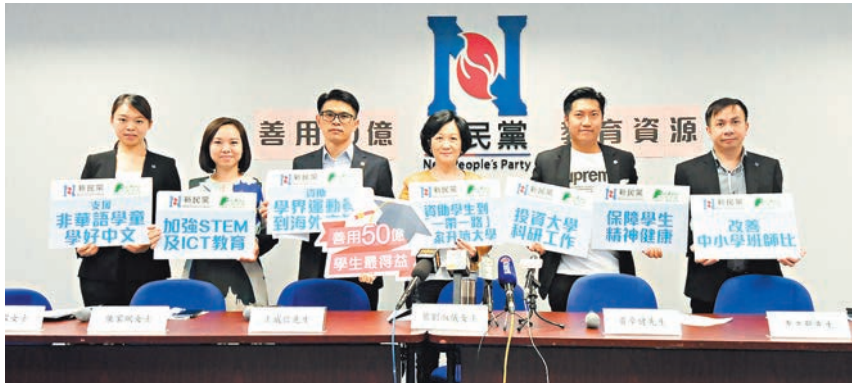
■新民黨就教育提出8個範疇共24項建議。

葉太續指，自己在香港土生土長，「我『本土』過很多現在的『本土』青年」，希望可以繼續為香港服務。被問到會否加入新一屆的行會，她透露自己曾經在個多月前與林鄭月娥「傾傾吓」，自己諮詢新民黨後獲得黨內普遍的支持，倘接獲正式邀請，她會很認真考慮，惟最終仍要由林鄭月娥決定。