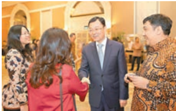
■謝鋒獲任命為外交部駐港特派員。圖為謝鋒6日在印尼舉行的離任招待會與友好握手。

據中國駐印尼使館網站消息，謝鋒大使夫婦在6月6日晚，在雅加達香格里拉酒店舉辦離任招待會，印尼政府、工商界、文化、媒體、智庫、華社代表等各界友好人士、各國駐印尼使節、中資企業、留學生和志願者教師代表等1,200餘人出席。