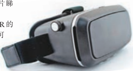
■VR眼鏡款式多。

元。VR與AR產業持續擴張,也已成為備受關注的投資題材,預期將可應用在許多領域和產業。去年以來許多科技大廠陸續推出VR頭戴式裝置,包括Facebook的Oculus Rift、SONY的PS VR。花旗預測,硬體的銷售,尤其是頭戴式裝置,將成為VR/AR產業的主要成長動能,2025年時規模將達6,920億美元,並在未來十年內突破1兆美元,單位價格最終會降到200美元以下。