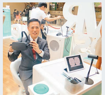
■信置推出「VR@Sai Kung 虛擬實境體驗區」推銷逸瓏海滙及逸瓏園。資料圖片

不過,至今發展商仍未有予準買家用VR來睇示範單位,相信是因為這樣做,示範單位場外便聚集不到萬人空巷的睇樓場面,達不到宣傳效果。