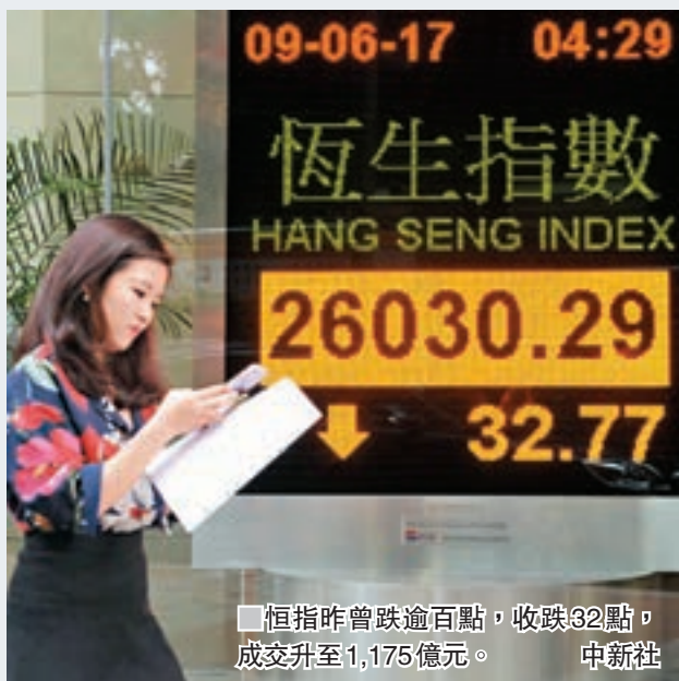
恒指昨曾跌逾百點，收跌32點，成交升至1,175億元。