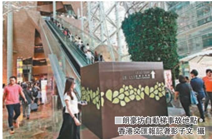
朗豪坊自動梯事故地點。