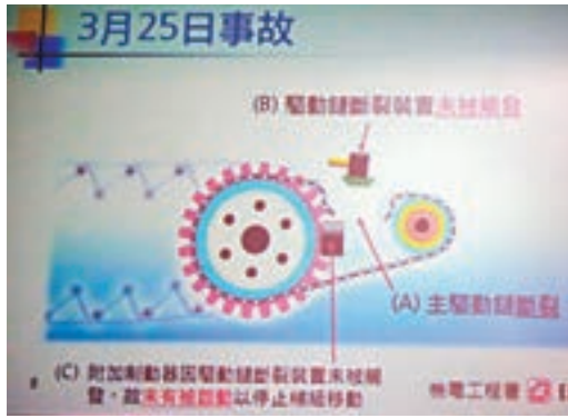
機電工程署調查報告中圖示事故成因。

香港文匯報訊(實習記者 陳鳳鳴)旺角朗豪坊於3月25日發生自動梯超速倒行事故，震撼全城。機電工程署完成調查，並於昨日發表技術調查報告，指事故主要是扶手電梯的「主驅動鏈」和監察裝置BCD雙重失效所致，事故原因非常罕見，屬本港首例。機電署經調查後確定自動電梯當時沒有超載，懷疑有人沒有按正常程序進行維修保養，將進一步調查事故原因，並尋求律政司意見，不排除作出刑事調查。該署已吊銷兩名涉事工程人員註冊資格6個月。