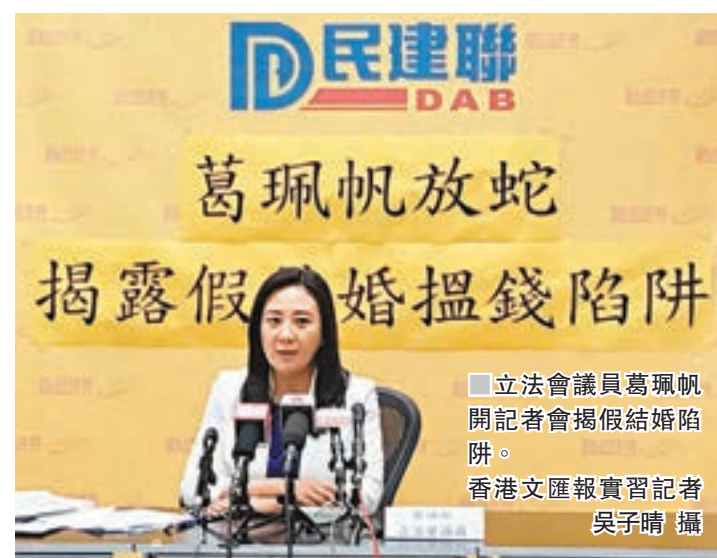
立法會議員葛珮帆開記者會揭發假結婚陷阱。

未婚證明，藉此呼籲市民多加防範。她已將資料轉交保安局、入境處及警方跟進，促請政府加強打擊及執法，多加宣傳及教育公眾假結婚的嚴重性，以免市民被不法分子所利用。任何人參與假結婚過程中可能已干犯發假誓、提供虛假資料、向入境處職員作虛假陳述及串謀欺詐等罪行。根據香港現行法例，如干犯串謀欺詐罪行，一經定罪，最高可被判監14年。另外，任何人向入境處職員作虛假陳述亦屬違法，一經定罪，最高刑罰為罰款15萬元及監禁14年，其協助教唆者亦會遭檢控。單是去年便有98人因假結婚而被成功定罪，刑期由4至18個月不等。