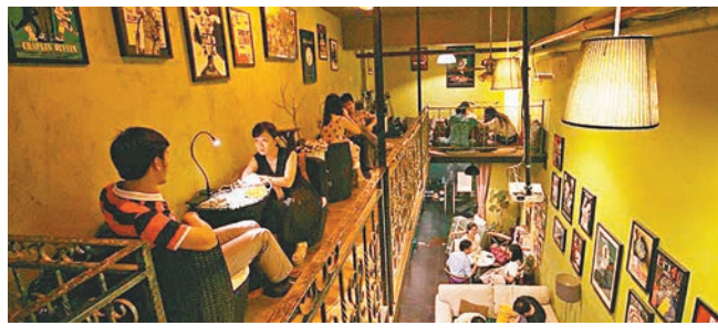
■深圳「小津概念書房」成為深港兩地獨立電影愛好者的據點。

不得不介紹的是，飛地書局出版的《飛地》雜誌，每年四期，高逼格，匯集內地最好的詩人和藝術家作品，這也是飛地書局和內地絕大多數獨立書店的不同之處，因為書店本身在集結輸出精神價值。