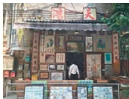
■廣州藏匿街巷的舊書店。