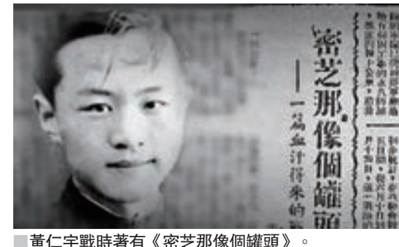
黃仁宇戰時著有《密芝那像個罐頭》。

1944年10月18日，中國駐印軍總司令史迪威奉召回國。在惜別中國的時刻，他專門致信重慶大公報。史迪威寫道：「親愛的總編先生，在本人即將從中國戰區解職離任之際，請允許我請求您向中國人民表達我對他們英勇鬥爭取得成功結果的最良好祝願。我一向尊重中國人民的堅強性格和優秀品質，並以有幸同他們短暫合作為榮……我痛惜自己再也無法同中國人民共同作戰，使中國自由和強大。然而我深信他們可以一如既往獲得美國人民的支持。我還相信我們兩國的友誼將會一直繼續下去。真誠的，J-W-史迪威，美國將軍。」