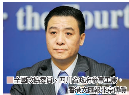
■ 全國政協委員、四川省政府參事王康。

人力資源是供給側五大要素之一，而高等教育的一項重要責任就是為經濟建設服務。全國政協委員、四川省政府參事王康在今年兩會專門就在高教領域實施「供給側結構性改革」遞交了提案。他指出，作為人力資本的主要供應端之一，中國的高教領域還沒有主動行動起來，有效提高科技人才供給與經濟發展需求的吻合度，本身就是「供給側結構性改革」的題中應有之義。