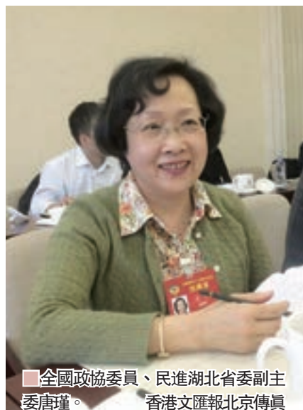
■ 全國政協委員、民進湖北省副主委唐瑾。

說起最新高考改革，一直關注高等教育的全國政協委員、民進湖北省副主委唐瑾在接受香港文匯報記者專訪時表示，新高考改革方案將在一定程度促進學生加大對傳統文化的重視，提高學生對傳統文化的閱讀量。