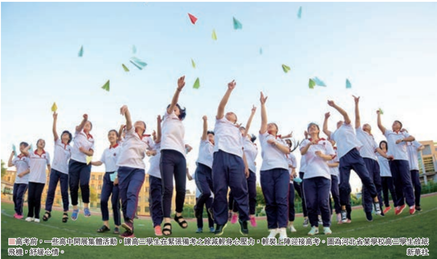
■ 高考前，一些高中開展集體活動，讓高三學生在緊張備考之餘減輕身心壓力，輕鬆上陣迎接高考。圖為河北省某學校高三學生放紙飛機，舒緩心情。

他說，教育政策的價值選擇和利益訴求的平衡非常複雜，體現了教育決策者對社會發展和教育發展趨勢的價值判斷，政策的制定需要突出重點，落地實施，「我們對高考政策既要有批判性也要有建設性，不能僅從某