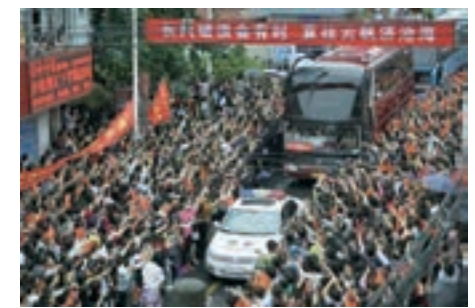
■ 本月5日，28輛載滿考生的大巴車從安徽毛坦廠中學校園緩緩開出，萬餘民眾冒雨相送。資料圖片