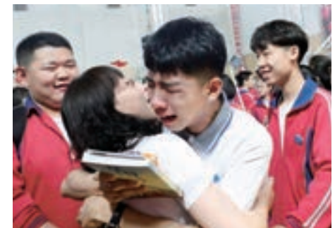
■ 內蒙古某校舉辦畢業典禮，為高考生鼓勁。圖為學生與老師擁抱在一起。

全國政協委員、河南大學校長婁源功深感教育資源不均衡之弊，呼籲教育公平多年。他指出，高等教育改革發展應着眼於優質高等教育資源共建共享，把人口、教育人口作為優先考慮的資源配置要素，在世界一流大學和一流學科建設中，向中西部人口大省、教育人口大省傾斜，向歷史悠久、社會聲譽好、辦學質量高的中西部地方高水平大學傾斜，並將其納入建設支持行列，使中西部地區高水平大學也有機會獲得國家層面支持，讓廣大學子尤其是中西部地區學子，享受更優質、公平的教育。