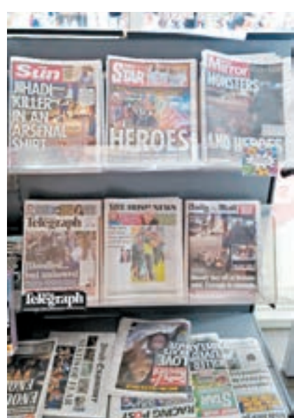
貝爾法斯特的報攤同時售賣英國及愛爾蘭的報紙。

北愛爾蘭幅員不大，在英國國會650個議席中僅佔18席，一直未成焦點。不過，跟英格蘭及蘇格蘭地區相比，貝爾法斯特的選舉宣傳較多，當中又以新芬黨的宣傳攻勢最強，該黨在貝爾法斯特不同地區部署不一，以針對各階層的選民。至於在同性戀酒吧林立的西北部地區，新芬黨則特別掛上爭取同性婚姻的海報，希望爭取北愛早日通過同性結合，與英國其他地區以至愛爾蘭看齊。新芬黨主張北愛與愛爾蘭脫離英國，更