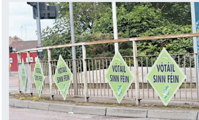
新芬黨在馬路邊擺放多塊街板宣傳。