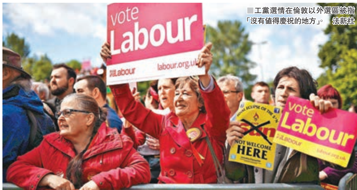
工黨選情在倫敦以外選區被指「沒有值得慶祝的地方」。

由於英國選區眾多，民調機構難以在650個選區逐一抽取足夠樣本訪問，使民調存在先天局限，或許正是英國民調在過去大選中多次失準的原因之一。