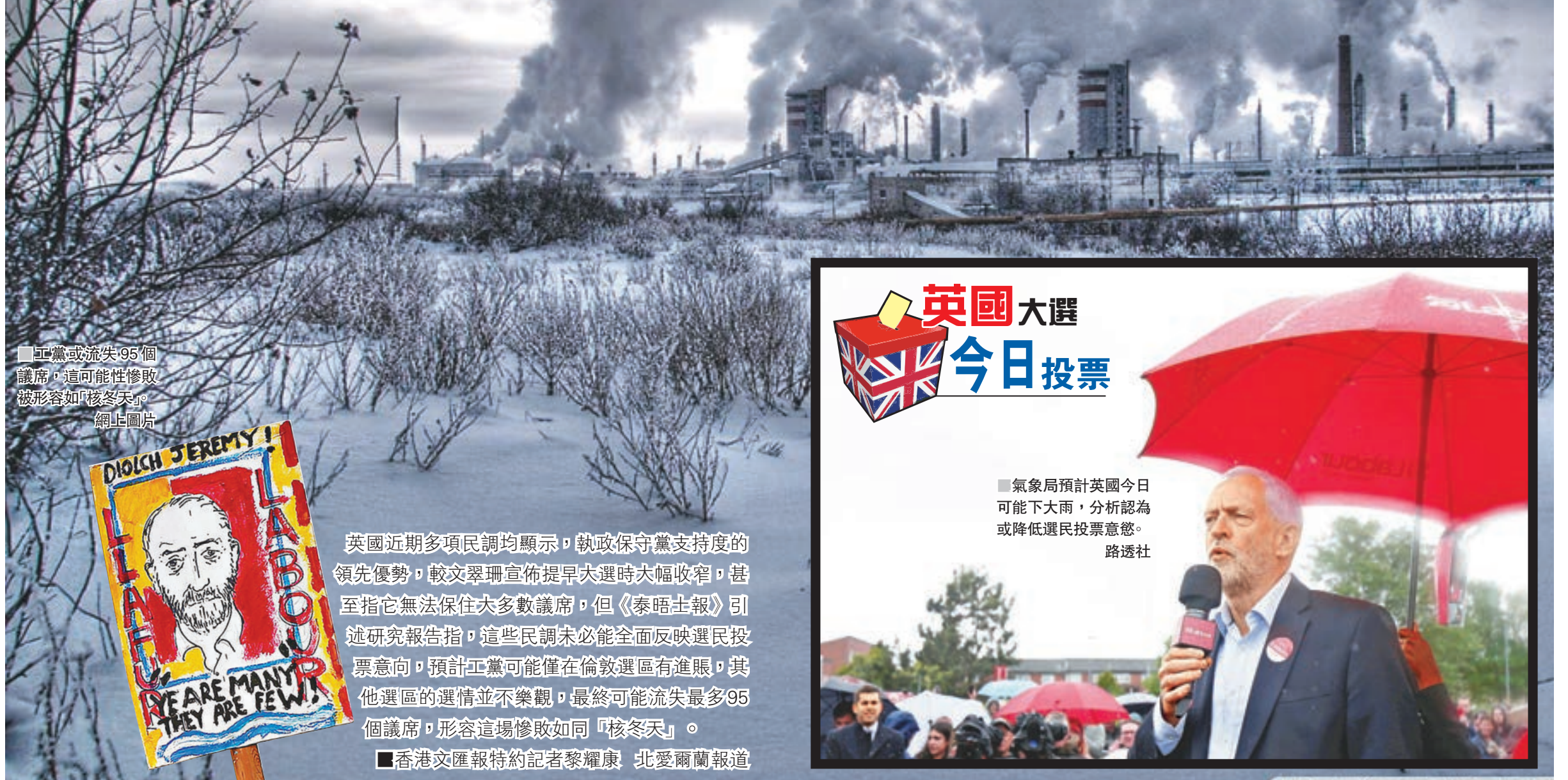
工黨或流失95個議席，這可能性慘敗被形容如「核冬天」。