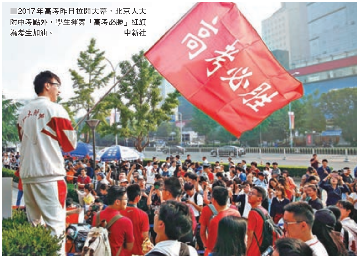
2017年高考昨日拉開大幕,北京人大附中考點外,學生揮舞「高考必勝」紅旗為考生加油。

記者在現場採訪發現,除了幫助孩子調整心態外,家長們最操心的就是每頓飯吃什麼,從早中晚三餐,再到水果牛奶,他們希望孩子能以最好的身體狀態和最佳的心理承受力奔赴考場。