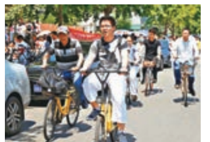
「共享單車」列為高考作文題,顯現今屆試題貼近時代。圖為家長騎「共享單車」迎接考生。中新社

入新世紀以來作文題的不限體裁、二選一的作文題增多,高考作文的變化有目共睹。教育界人士認為,作文是為了考察學生的邏輯思維和語言功底,從某種程度上說沒有對錯之分,因此讓學生有話說才是高考作文改革的方向。中新社