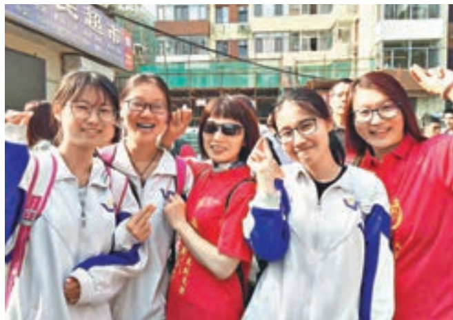
老師紅衣送考,寄語「馬到成功」。

最後,民警用摩托車載著該女教師一路趕回賓館,途中甚至有不得已的逆行,才在開考前取回了准考證。華網