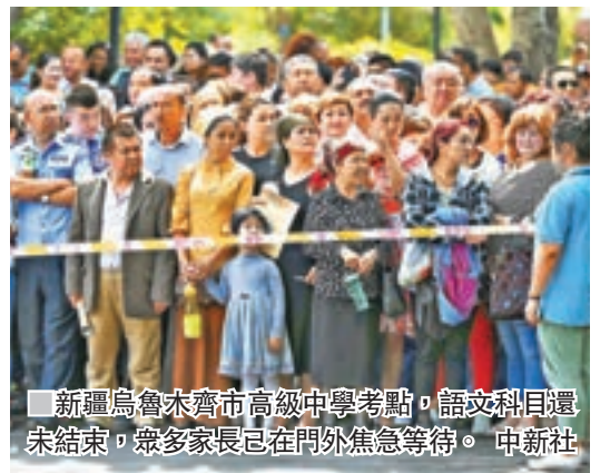
新疆烏魯木齊市高級中學考點,語文科目還未結束,眾多家長已在門外焦急等待。