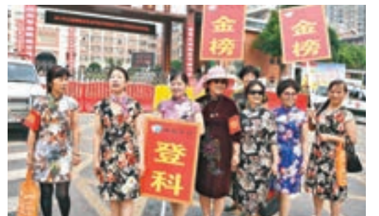
幾位身著旗袍的家長高舉「金榜登科」的牌匾為考生加油,旗袍寓意旗開得勝。