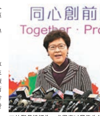
林鄭月娥認為，求學應以興趣先行，有興趣就會更加投入。

讀書幾乎年年第一、仕途順利的她，也向大家分享自己的挫折經驗。林鄭月娥說，自己在個別推動政策的過程中曾有些挫敗感，例如一些自覺想得通透、想解決問題的政策，結果在政治上引起負面迴響及猜忌，例如為香港建設香港故宮文化博物館。她說，這項目無論從香港作為文化大都會、吸引遊客、為年輕人開拓文化藝術工作空間都是大好事，但做大好事的過程複雜、困難，「重要國家文物要長期在港展出，很多地方都