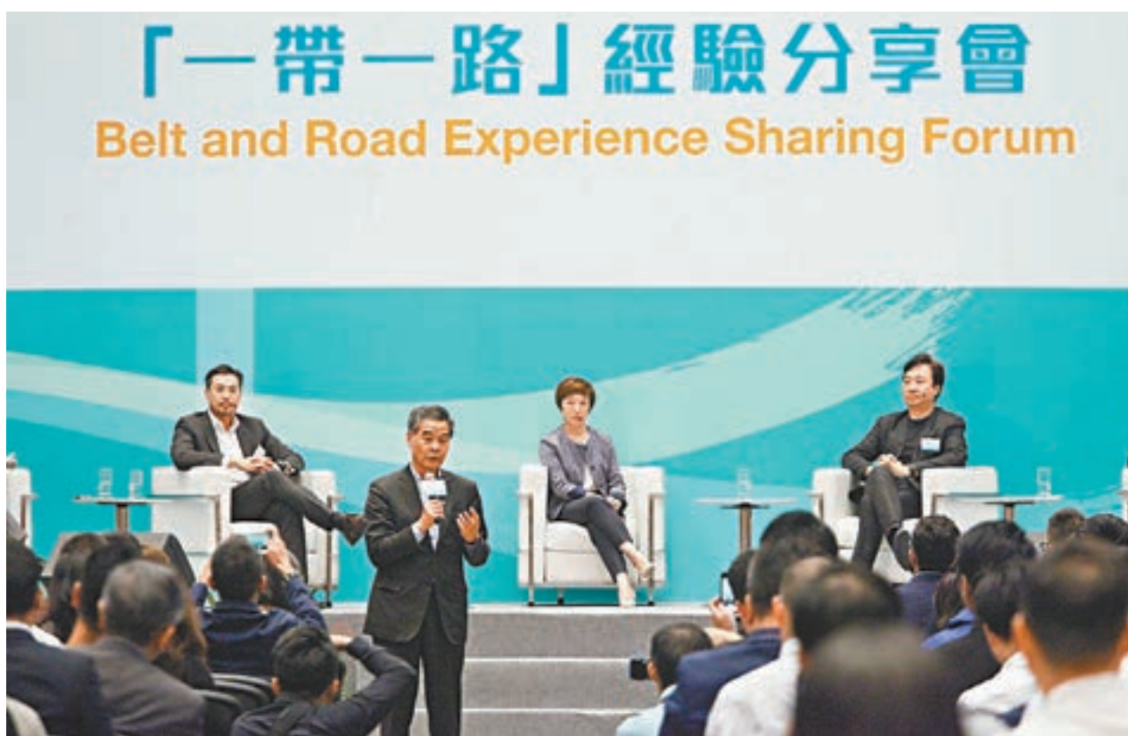
梁振英出席「一帶一路」經驗分享會致辭。

梁振英回憶三四十年前的香港社會，內地改革開放為香港社會帶來前景，為不同學歷的青年人提供大量機會。由於改革開放，相當多的香港專業人士、金融人才及各方面行政人才在內地長時間居住、工作。據不完全統計，現居住在北京、上海、廣州的