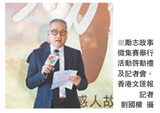
勵志故事徵集賽舉行活動啟禮及記者會。