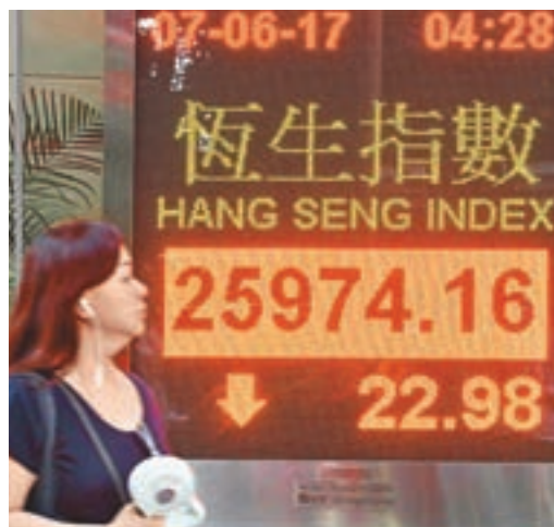
恒指二萬六關再得而復失，成交869.89億元。 中新社

因此，當企業遭遇沽空狙擊時，本身並無造假的企業，應通過積極回應，擺出事實根據，不但收復失地，如恒大，股價目前比被沽空前更高。對於投資者來說，則更應保持理性，辨別真偽。 ■記者 蔡競文