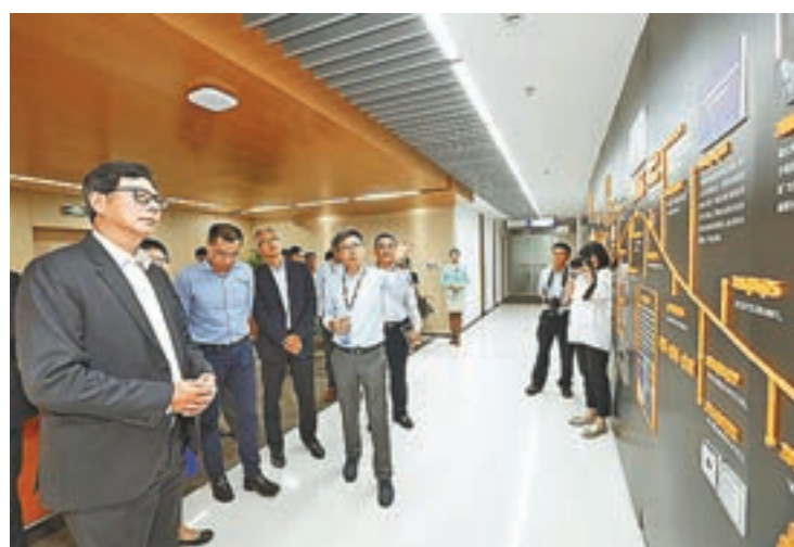
陳德霖(左一)參觀微眾銀行，由副行長及首席信息官馬智濤(左四)講解金融科技在銀行服務上的應用。

通過這次交流，金管局與深圳金融辦同意加強兩地合作，為銀行及金融機構在應用金融科技方面，提供更有利發展的環境，並推出下列合作項目：一、深圳金融辦應金管局邀請，同意參與於今年下半年在港舉行金融科技高峰會，促進兩地金融科技人員的交流和合作；二、深圳金融辦應金管局邀請，同意參與舉辦大型金融科技比賽，提供平台讓各地的金融科技創業者展示其產品及服務，鼓勵創新，提升行業水平。有關詳情會於年內公