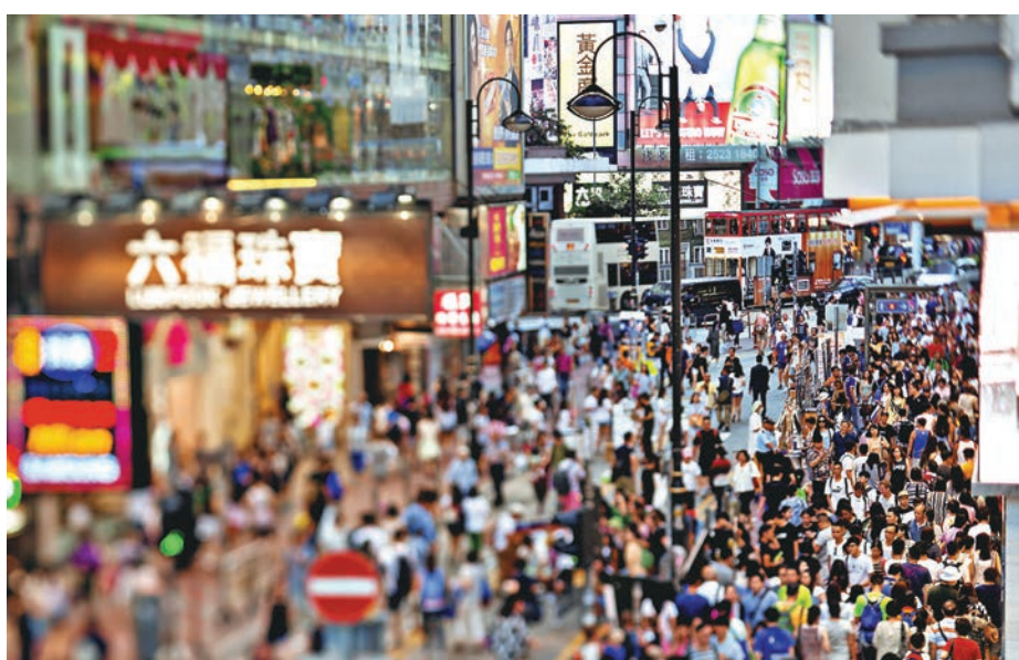
5月的數據反映，本地市場環境仍頗具挑戰。